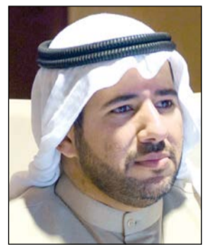
الشيخ عبدالله الأحمد

مع الجهات المعنية لأن يسترد الجون عافيته إثر تعرضه لاستنزاف حاد في موارده في الأونة الأخيرة. وقال الشيخ عبدالله الأحمد إن الهيئة تعمل على رفع الضرر عن الجون وتباشر في إنجاز المشاريع الجادة لتأهيل تلك المنطقة ومساعدتها على النمو