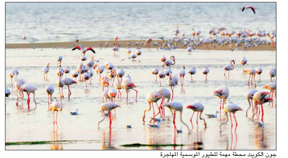
جون الكويت محطة مهمة للطيور الموسمية المهاجرة