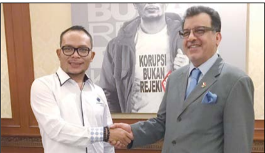
السفير عبدالوهاب الصقر مع وزير القوى العاملة الإندونيسي

كوالإلبور - كونا: أشاد وزير القوى العاملة الإندونيسي محمد حنيف تكيري بالعلاقات «التميزة» بين الكويت واندونيسيا والتعاون المثمر بينهما في مجال تصدير العمالة المدربة الفنية والمنزلية. جاء ذلك خلال مباحثات أجراها الوزير تكيري أمس الأول الخميس مع سفيرنا لدى اندونيسيا عبدالوهاب الصقر تناولت أوجه علاقات التعاون بين البلدين وسبل تعزيزها وتطويرها بما يخدم المصلحة المشتركة. وقال الوزير الإندونيسي ان «التعاون في مجال تصدير العمالة للخارج على أسس جديدة وواضحة سيكفل حقوق الطرفين» داعيا في الوقت ذاته المستثمرين