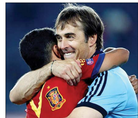
مدرب إسبانيا جوليان لوبيتيفي متفائل بالمستقبل

وأضاف: «الأهم هو الإيمان بقدرة لاعبينا وأن نجعلهم يؤمنون بأنفسهم وأن نرسم لهم الطريق». واعترف المدرب الإسباني بأنه يفكر في استدعاء بعض اللاعبين