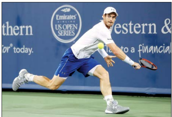
البريطاني اندي موراي يرد ارسال منافسه الأرجنتيني خوان مونكو (أ.ب)

1-6 و7-6 (5-7). تاهل كيرب وهاليب ولدى السيدات تاهلت الألمانية أنجيليك كيرب المصنفة ثمانية إلى الدور الثالث بفوزها على الفرنسية كريستينا ملادينوفيتش 6-0 و7-5. وتملك كيرب حاملة فضية أولمبياد ريو فرصة انتزاع صدارة التصنيف العالمي للاعبات المحترفات في حال