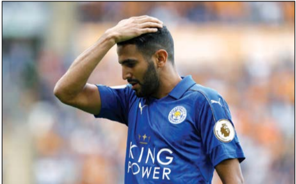
رياض محرز فضل التجديد مع ليستر

فاردي، الحارس كاسبر شمايكل وأندي كينغ. كما جدد المدرب الإيطالي كلاوديو رانيري قبل أيام عقده مع ليستر لأربع سنوات إضافية.