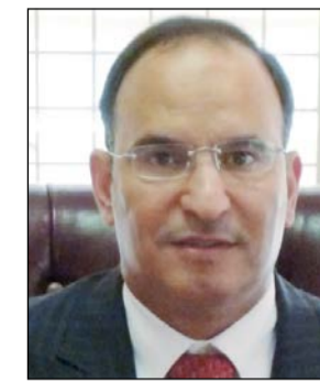
السفير منصور العتيبي

لا يجاورونك فيها إلا قليلا)، وهؤلاء المرجفون القوم الذي كانوا يشيعون أخبار السوء ويخوفون المسلمين. وقد رسم لنا القرآن الكريم ان نتثبت وان نختين عند سماع الشائعة (أيها الذين آمنوا ان جاءكم فاسق نبأ فتبينوا ان تصيبوا قوما بجهالة فقصبحوا على ما فعلتم نادمين). أما نشر الشائعات الكاذبة فهو محرم شرعا بل كبيرة من الكبائر، ولفت الى ان مندوبنا الدائم لدى الامم المتحدة السفير منصور العتيبي قد نفي ما بثته بعض وسائل الاعلام الحاقدة، وأكد ان جمعية إحياء