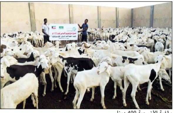
وقفية الأضحية 400 دينار