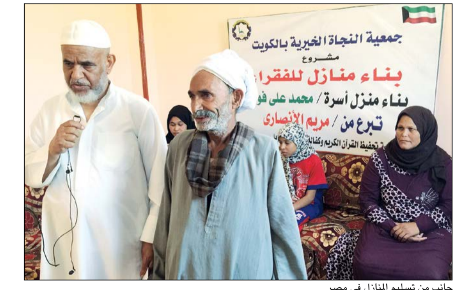
جانب من تسليم المنازل في مصر

بذلك سبل العيش الكريم للشباب. وختاما تقدم الخميس الى أهل الخير الذين رسموا حياة جديدة يحدها الأمل والسعادة والبسمة للفقراء، الذين رأيناهم وهم يرفعون أكف الضراعة سائلين الله جل وعل أن يحفظ الكويت وأهلها، وأن يتقبل بهذا الصنيع الحسن ميزان أعمالهم يوم القيامة، مذكر بأنه يمكن التبرع عن طريق الزيارة لمقرات جمعية النجاة الخيرية أو أي لجنة من لجانها التابعة لها أو الاتصال على الأرقام التالية: 24833408 - 66293044 فهناك بعض المنازل القديمة تحتاج من أهل الخير المساعدة بالدمع بالمبلغ المطلوب وقيمتها 5 آلاف دينار قيمة التكلفة حتى التسليم.