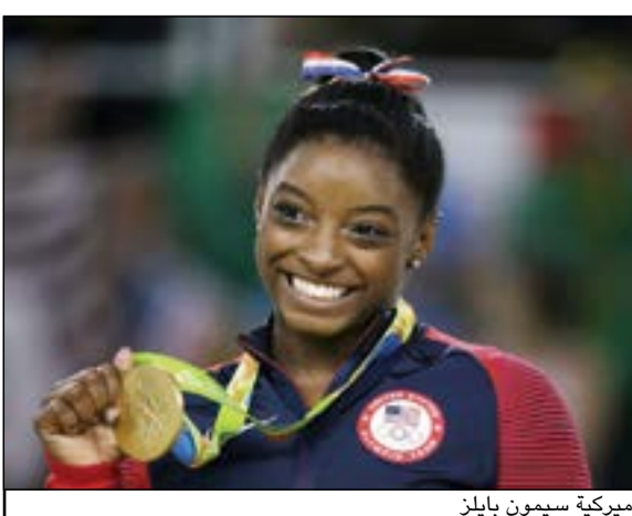
الأميركية سيمون بايلز

واكملت بايلز (19 عاما) الرباعية في اول مشاركة أولمبية، وباتت رابع رياضية تحرز 4 ميداليات ذهبية في رياضة الجمباز خلال دورة واحدة. وانضمت بايلز التي توجت في المسابقة العامة (فردية وفرق) وحصان القفز، الى السوفياتية لاريسا لاتينينا (1956) والتشيكية فيرا تشاسلافسكا (1968) والرومانية ايكاترينا تسابو (1984). وجمعت بايلز التي فشلت في الانفراد بالرقم القياسي بعدما اكتفت برونزية العلة، 15,966 نقطة، وتقدمت على الكستندرا رايسمان (15,500 نقطة)، فيما ذهبت البرونزية إلى البريطانية آيمي تينكلر.