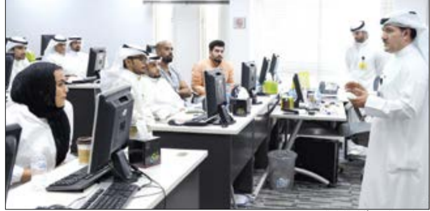
الموظفون الجدد أثناء اللقاء التثويري

عقدت «زين» لقاء تثويري للدفعة الجديدة من موظفي مركز الاتصال (107) في مقرها الرئيسي في الشويخ، وذلك بهدف تعريفهم على استراتيجية الشركة الساعية لتقديم أفضل مستويات خدمة العملاء لأكثر قاعدة مشتركين في الكويت.