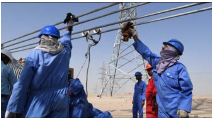
عدد من العاملين بالمشروع

وأشار إلى أن مشاريع النقل مكملة لمشاريع إنتاج الطاقة الكهربائية، وإبصار الطاقة الكهربائية إلى المدن الإسكانية الجديدة حلقة يجب أن تتكامل مع بقية مشاريع إنتاج الطاقة، وتتناغم جميعها بعضها البعض، مبيناً أن قطاع شبكات النقل الكهربائي لديه بحدود 50 مشروعاً ما بين التوقيع والتنفيذ بميزانية 230 مليون دينار وهي مخصصة لمشاريع النقل فقط، بالإضافة إلى أن هناك مبادرات أخرى لمحطات الطاقة الكهربائية والتوزيع. وأشار إلى أن وزارة الكهرباء والماء مثلها مثل بقية الوزارات في الدولة تسعى دائماً إلى تقنين وتوجيه صرف إلى المشاريع الاستراتيجية المهمة التي تستخدم في النهاية في صالح المواطنين.