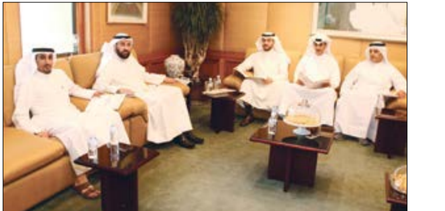
وفد نقابة العاملين بالأشغال خلال لقاءهم د.علي العمير

من جانبه شكر عضو مجلس إدارة ونائب رئيس الاتحاد العربي للزراعة والصناعات الغذائية والصيد هادي المسحلي الوزير على إتاحة الفرصة لمقابلته وأعضاء النقابة وعرض مطالب وحقوق الموظفين في الوزارة، متمنياً منه تحقيق هذه المطالب الرصيدة التي من شأنها تشجيع وتحفيز الموظفين على بذل المزيد من الجهد لدعم مسيرة التنمية، مشيراً إلى أنه تم استعراض العديد من المطالب خلال الاجتماع من أهمها استدلال اجازات بديل نقدي وبديل تنقل للموظفين القانونيين وتركيب ماكينة صرف عند مدخل الوزارة خاصة أن هناك موافقة بذلك بالإضافة إلى تركيب ماكينة كروت الاتصالات الخاصة بتعبئة الرصيد واستثمار بعض المقاصف بمرکز العمل داخل الوزارة والفروع الخارجية وإنشاء ناد للموظفين وتنظيم دورات ومؤتمرات مع قطاع التخطيط وتوسيع مقر النقابة بالوزارة.