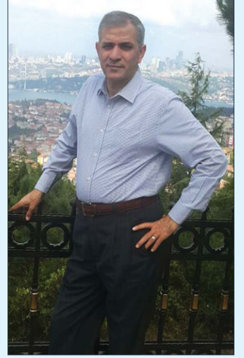
اسطنبول - «الانباء» عاطف عيسى

مساء الجمعة 15 يوليو.. لم يكن ككل مساء في تركيا والمنطقة والعالم.