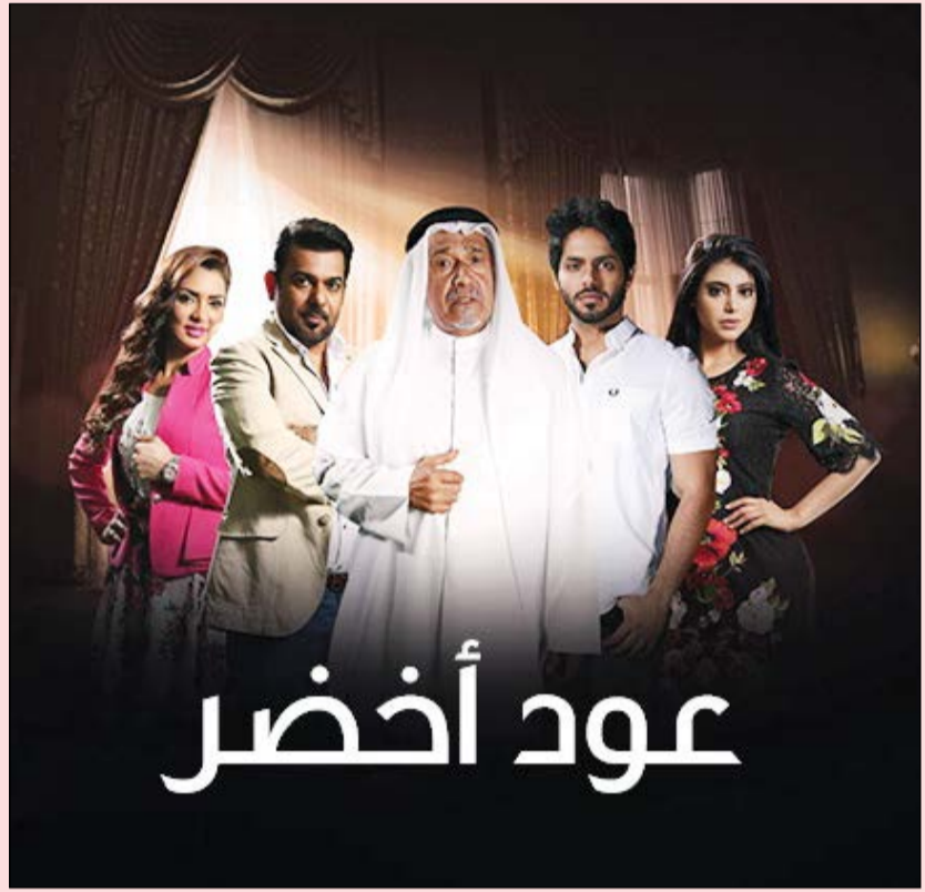
بوستر مسلسل «عود أخضر»

الى مركز الشرطة حفاظاً على حقوقهم المادية بعد الجهد الذي بذلوه في تصوير هذا المسلسل التي كتبتة د. حصّة الملا.