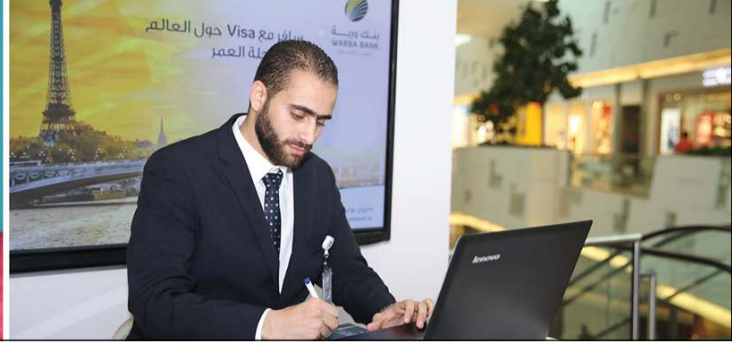
من أنشطة نادي الأطفال الصيفي برعاية «وربة»