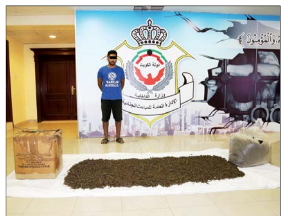
المتهم الباكستاني وأمامه المضبوطات

إلى مباحث الفروانية عن طرد بريدي سيصل عبر الإمارات إلى الكويت ومصدره الهند ويحتوي على مواد المخدرة المذكورة ويستوردها لصالحه وافر من الجنسية الباكستانية باعتبارها أوراق شاي. وذكرت الإدارة الإدارية أنه بعد اتخاذ الإجراءات القانونية قامت إدارة مباحث