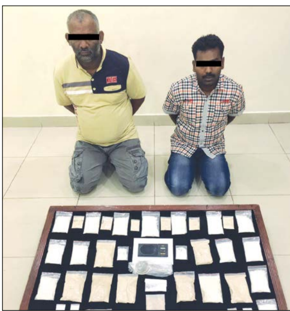
الوافدان السيلانيان وأمامهما الهيروين والشبو