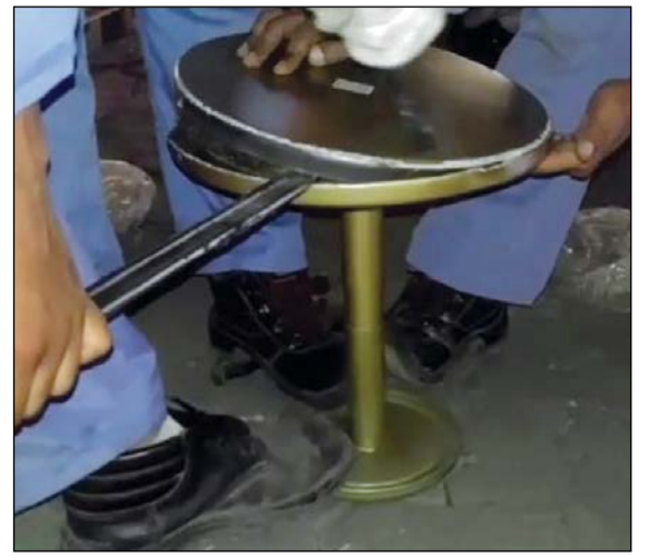
فتح أحد الحوامل