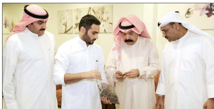
اللواء محمود الطباخ والمعيد محمد الشهران ومدير مباحث الفروانية بالانابة

بأنه جلب هذه المواد المخدرة إلى البلاد بقصد الاتجار بها مستغلاً اسم شركة له مع شخص آخر شريك له، وبأنه اعتاد على جلب هذه المواد المخدرة منذ مدة، وهذا وأحيل المتهم إلى جهات الاختصاص لاتخاذ الإجراءات المناسبة بحق، هذا وقد تم المضبوطات بـ 15 كيلو ماريغوانا.