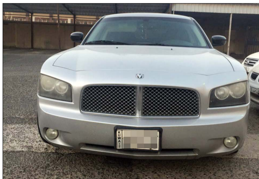
السيارة المستخدمة في نقل الجثة إلى المنزل المهجور