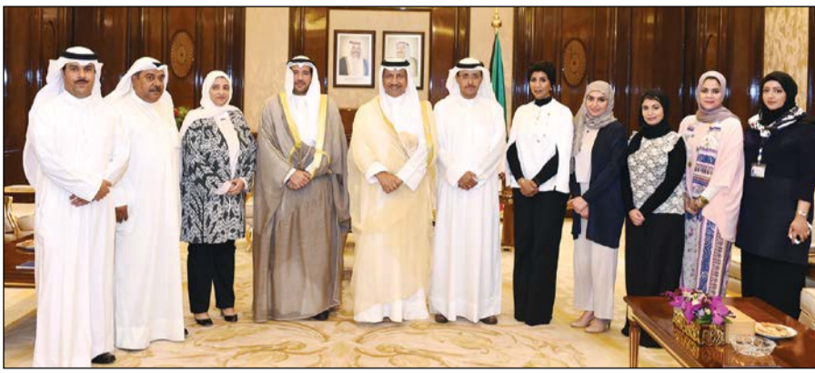
سمو رئيس مجلس الوزراء الشيخ جابر المبارك مستقبلا الشيخ عبدالله الأحمّد وعددا من المسؤولين والعاملين في هيئة البيئة

وقال الأحمّد أن فوز الهيئة بالجائزة العالمية يأتي تأكيدا على دورها على الصعيد المحلي والعالمي، مبيّنا أن الجائزة هي الـ 15 التي تخصصها الهيئة في السنوات الست الماضية محليا وإقليميا ودوليا. وأكد أن إنشاء الكويت لقاعدة بيانات متكاملة للوضع البيئي وإطلاقها لبوابة بيئية وطنية حظي بنجاحات إقليمية وعالمية وساهم في التقدم بمقترح إنشاء بوابة بيئية خليجية تكون بمنزلة واجهته لدول المجلس في المجال البيئي على الصعيد المحلي والدولي الأمر الذي كُفّت بموجبه الهيئة من قبل وزراء البيئة في دول مجلس التعاون بإنشاء هذه البوابة.