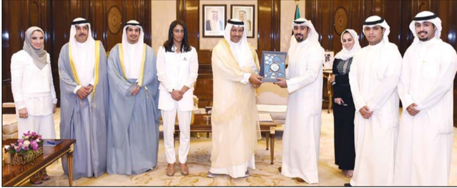
سمو رئيس مجلس الوزراء الشيخ جابر المبارك مستقبلا عبدالرحمن المطيري ومسؤولين بهيئة الشباب

لقدرات الهيئة في مراقبة المواقع البيئية وجميع الأنشطة في الكويت باستخدام نظم المعلومات الجغرافية الخاصة بتحديد المواقع والاستشعار عن بعد. وأوضح الأحمّد أن الهيئة أطلقت الشبكة الوطنية التي تتكون من 15 محطة رصد عائمة تعمل على الرصد اللحظي المستمر للبيانات الفيزيائية والكيميائية والبيولوجية للبيئة البحرية الكويتية، مضيفا أنه روعي في اختيار مواقع الشبكة تغطية الأمان الحساس بيئيا والأنشطة البشرية على السواحل. وأكد أن محطات الرصد العائمة الجديدة ستعزز قدرات هيئة البيئة في الاستجابة السريعة للطوارئ البحرية والخطو المسبق بمجموعة من الظواهر البيئية عبر قياس أكثر من 15 مؤشرا للمياه والهواء إلى جانب مراعاة استخدام تكنولوجيا متخصصة في حماية المحطات