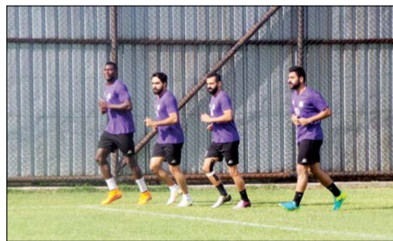
تدريبات العربي متواصلة في تركيا

الظروف المناخية في المعسكر جيدة ومناسبة، ورغم أن بعض الأمطار عصفت علينا واضطر المدرب إلى تحويل الحصة التدريبية يوم أمس الأول إلى صالة الحديد إلا أن الخطة المعتمدة تضم في طياتها خطة طوارئ لتفادي حدوث أي مشكلة وذلك لضمان استفادة اللاعبين من كل حصة تدريبية. وقال: اللاعبون منتظمون وحريصون على الاستفادة من كافة الحصص اليومية، ولمسنا