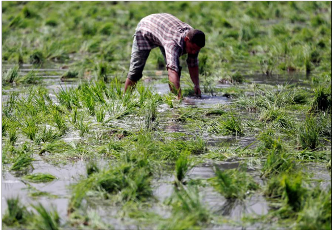
إحدى مزارع الأرز في محافظة القليوبية هذا العام (رويتزر)