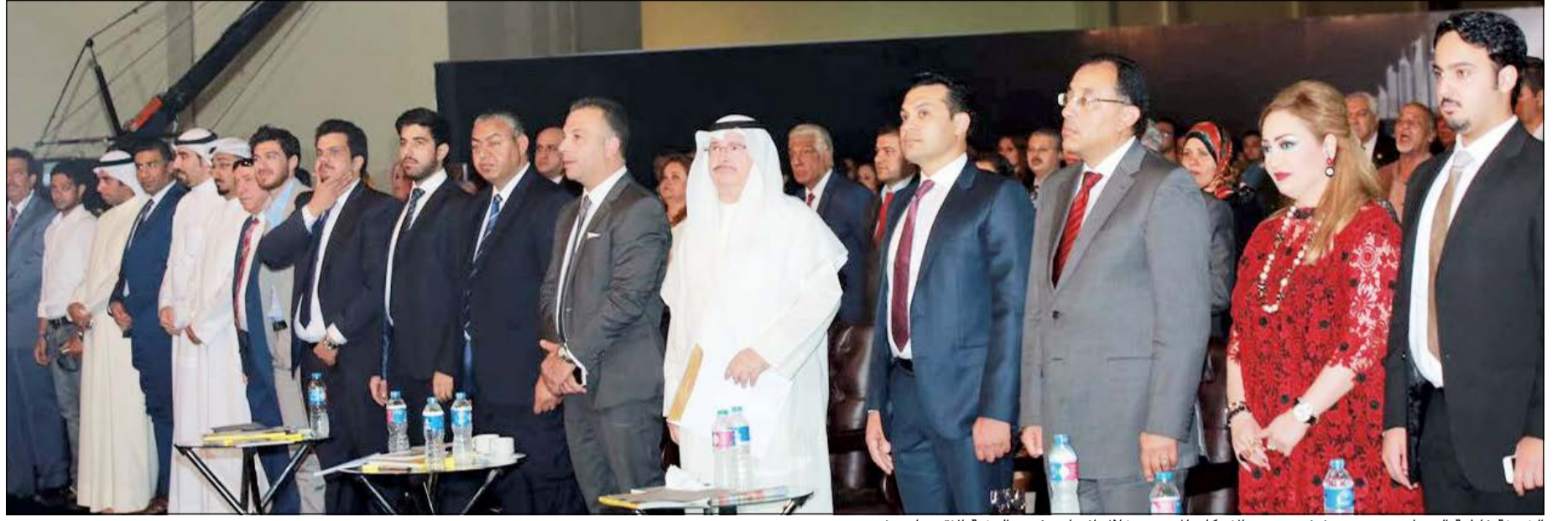
الشيخة فاطمة الصباح ومحمود عفيفي وزير الإسكان المصري خلال افتتاح مؤتمر النخبة الاقتصادي في مصر

أعلنت مجموعة إسكان جلوبل لتنظيم المعارض والمؤتمرات استكمال استعداداتها لإطلاق معرض النخبة العقاري في دورته الجديدة بفندق الجميرا خلال الفترة من 17 وحتى 20 أكتوبر المقبل. وقال نائب رئيس مجلس إدارة مجموعة إسكان جلوبل أحمد عفيفي في تصريح صحفي: «نستكمل حالياً استعداداتنا لإطلاق الدورة الجديدة من معرض النخبة العقاري في فندق الجميرا، وسيكون المعرض بمشاركة أكثر من 35 شركة ومؤسسة عقارية من داخل الكويت وخارجها وتتنافس هذه الشركات على تقديم أكثر من 100 مشروع عقاري وفرصة استثمارية حول العالم بعروض خاصة للمعرض». وأضاف أن هذه الدورة ستكون مميزة وتم الإعداد لها بشكل خاص وستصاحبها فعاليات غير مسبوقه، فهي تأتي بعد أشهر قليلة من النجاح الباهر والكبير لأكورة معارضنا العقارية في جمهورية مصر العربية، وهذا النجاح يضعف مسؤولياتنا ويحتم علينا بذل المزيد من الجهد للحفاظ على ريادة «إسكان جلوبل» في مجال تنظيم المعارض