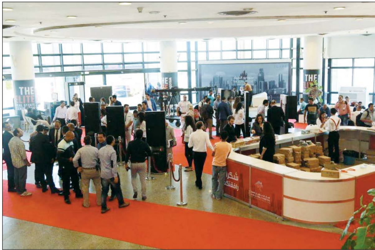
جانب من زوار معرض النخبة العقاري في مصر

والمؤتمرات في المنطقة العربية. وتابع قائلاً: «أقيم معرض النخبة العقاري في مصر تحت رعاية رئيس مجلس الوزراء المصري وشاركت فيه أكثر من 140 شركة من مصر والكويت ودول الخليج والشرق الأوسط مشروع، وصاحب المعرض مؤتمر اقتصادي ضخم بمشاركة خبراء ومختصين، كما صاحبه أيضاً مهرجان النخبة للإعلام العربي وتم خلاله تكريم عدد من المبدعين والنجوم العرب. وطرحت خلاله أكثر من 400 مشروع، وصاحب المعرض مؤتمر اقتصادي ضخم بمشاركة خبراء ومختصين، كما صاحبه أيضاً مهرجان النخبة للإعلام العربي وتم خلاله تكريم عدد من المبدعين والنجوم العرب. وأقيمت على هامشه حفلات غنائية أحيها الفنان عمرو خيرت والنجمة أنغام، وكان للنجاح الباهر والتوصيات القوية التي خرج بها مؤتمر النخبة المصاحب للمعرض صدى واسع داخل جمهورية مصر العربية، ومن المتوقع أن يسهم هذا المؤتمر في جذب رؤوس أموال خليجية للسوق المصري، ونجحنا بفضل الله في فتح قنوات استثمار جديدة بين السوقين الكويتي والمصري خلال هذا المعرض، وتشتمل خارطة معارضنا الخارجية لهذا العام على دورات جديدة