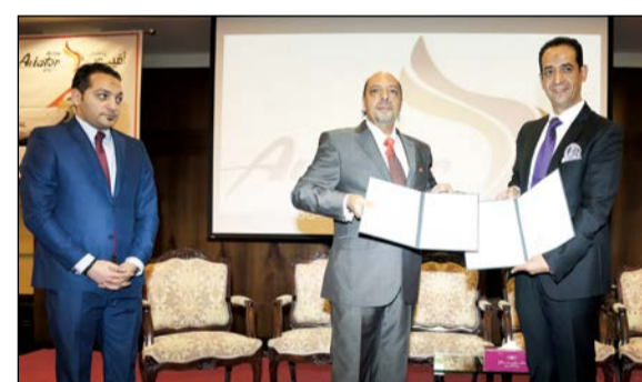
لحظة توقيع العقد بين مجموعة مساعداً الصالح وطيران أفيتور (ريليش كورمان)