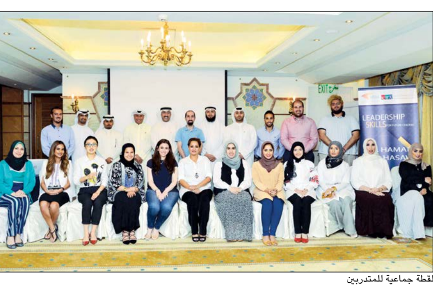
لقطة جماعية للمتدربين