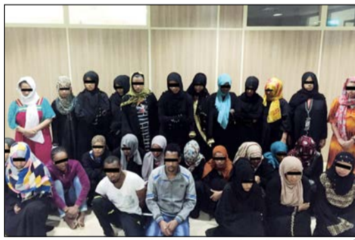
أعضاء التشكيل العصابي بعد القبض عليهم

ضبط رجال الإدارة العامة لمباحث شؤون الإقامة أفراد عصابة إتيوبية مكونة من 28 شخصاً تدير مكتبا وهميا للعبالة المنزلية. وكانت معلومات قد وردت عن عصابة من الجالية الإتيوبية تقوم بإيواء عدد من العاملات الأخريات عن كفلأهن ثم تشغيلهن عند أشخاص آخرين. وتبين من التحقيقات ان أعضاء التشكيل العصابي يقومون بتحريض العاملة على الهروب من منزل كفلها ثم تشغيلها عند شخص آخر، وأنهم مطلوبون في قضايا تخريب وانتهاء اقامة، حيث تمت إحالتهم إلى جهات الاختصاص.