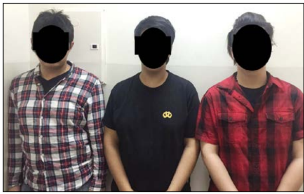
المتشبهون الثلاثة في قبضة الداخلية