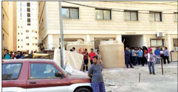
العمال متجمهرين أمام الشركة