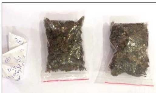
الماريغوانا المضبوطة في الصباحية