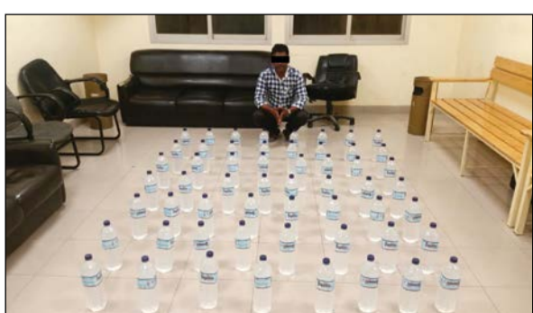
الهندي والخمر المضبوطة

القي رجال أمن الأحمدى أمس القبض على وافد هندي في منطقة المنقف، وعثر بحوزته على 56 زجاجة خمر محلية، وجار إحالته إلى الإبعاد الإداري.