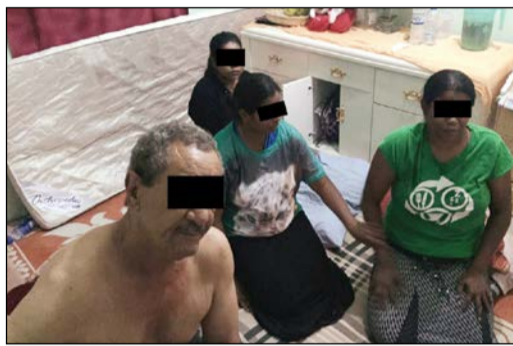
الحملة تاهمت الأوكار المنافية وضبطت وافدين في حالة تلبس