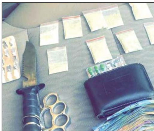
اكياس الشبو التي ضبطت بحوزة الإطفائيين

أبلغ مصدر أمني «الانباء» بان رجال الإدارة العامة لمكافحة المخدرات ألقت القبض يوم أمس الأول على مواطن يعمل عسكرياً في وزارة الداخلية. وأشار المصدر الى ان العسكري اعترف بانته متعاط وذلك بعد ان عثر بحوزته على ادوات تعاط، ونبت من خلال التحليل ان دمه به نسبة من المواد المخدرة، وجاء ضبط العسكري عقب معلومات مؤكدة على تعاطيه وخطورة تواجدته على رأس عمله. من جهة أخرى، القي رجال المباحث الجنائية امس القبض على مواطنين يعملان إطفائيين بعد معلومات عن تعاطيهما المخدرات في مقر عملهما، وعثر رجال المباحث بحوزتهما على نحو 10 اكياس شبو وادوات تعاط، وجار إحالتهما لجهة الاختصاص.