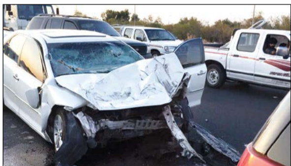
إحدى المركبات التي تحطمت في التصادم