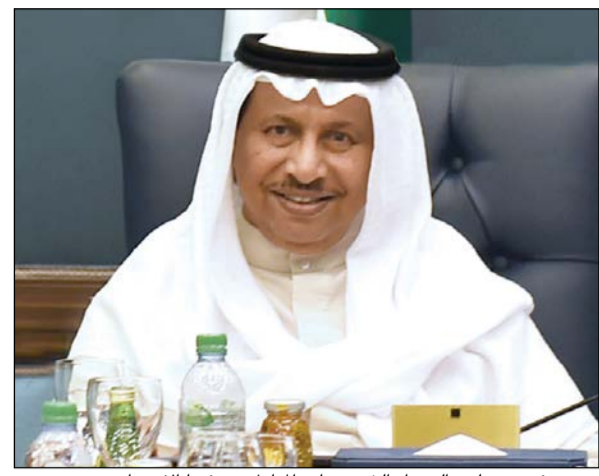
سمو رئيس مجلس الوزراء الشيخ جابر المبارك مترشقا الاجتماع

عقد مجلس الوزراء اجتماعه الأسبوعي بعد ظهر امس في قاعة مجلس الوزراء بقصر بيان برئاسة سمو رئيس مجلس الوزراء الشيخ جابر المبارك، وبعد الاجتماع قال وزير الدولة لشؤون مجلس الوزراء الشيخ محمد العبدالله: ان مجلس الوزراء استهل أعماله بالاطلاع على الرسالة الموجهة لصاحب السمو الأمير الشيخ صباح الاحمد، من الرئيس فرانسوا هولاند - رئيس الجمهورية الفرنسية، والمتضمنة شكره وتقديره على موقف الكويت إزاء الاعتداء الإرهابي الذي وقع في مدينة نيس خلال الاحتفال بالعيد الوطني، وعلى ما أكد صاحب السمو الأمير الشيخ صباح الاحمد، من وقوف الكويت إلى جانب فرنسا وتأييدها لكل ما تتخذه من إجراءات لمحاربة الإرهاب والحفاظ على أمنها واستقرارها. وقال العبدالله ان نائب رئيس مجلس الوزراء ووزير الداخلية ورئيس اللجنة العليا لتحقيق الجنسية الشيخ محمد الخالد أخط مجلس الوزراء بتوصية اللجنة بشأن سحب الجنسية الكويتية من 51 شخصا «حاصلين عليها بناء على غش ومعلومات كاذبة وشهادات غير صحيحة».