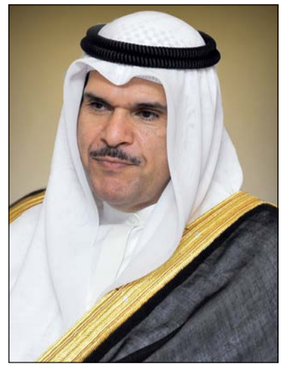
الشيخ سلمان الحمود

أشاد وزير الإعلام ووزير الدولة لشؤون الشباب الشيخ سلمان الحمود «بالمسيرة الإعلامية الحافلة للوزير الأسبق محمد السنغوسي وجهوده المبذولة في تطوير تلفزيون الكويت». وجاء ذلك عند استقبال الوزير الحمود للإعلامي محمد السنغوسي الذي أهدى الشيخ سلمان نسخة من كتاب (السنغوسي.. تلفزيون الكويت تاريخ وحكايات 1961-1985) الذي يوثق شخصيات وأحداث رافقت المراحل الأولى لانطلاق تلفزيون الكويت إلى آفاق التقدم والريادة على مستوى المنطقة. واعتبر الشيخ سلمان وفق بيان لوزارة الإعلام أن هذا الكتاب يعد مصدرا مهما لكل الإعلاميين لاسيما العاملين منهم في أزمته مختلفة.