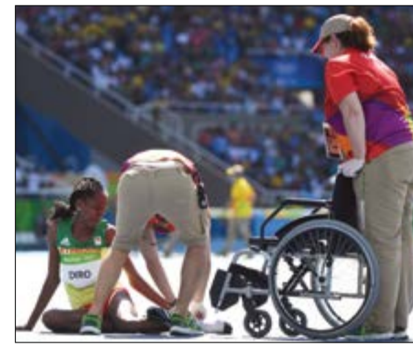
ديرو تتلقى العلاج جراء التواء قوي في كاحلها