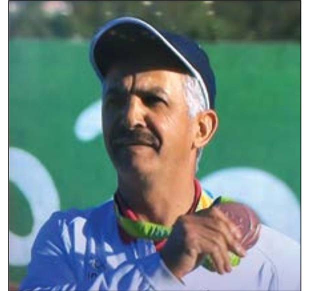
البطل عبدالله الفرجي الرشيدي يحمل الميدالية البرونزية