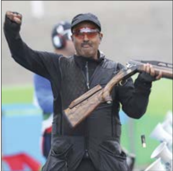
البطل فهد الديحاني