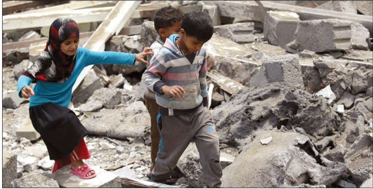
أطفال يمنيون يسرون وسط انقراض منازلهم في صنعاء أمس الأول

عواصم - وكالات: أكد قائد البحرية في مدينة بوشهر الإيرانية أمين خسروي، أن البحرية السعودية أوقفت 4 مراكب صيد إيرانية بالقرب من مياهها الإقليمية واقتادتها إلى جهة مجهولة، ونقلت وكالة «تسنيم» الإيرانية للأنباء عن خسروي قوله، في مؤتمر صحافي في مدينة بوشهر، أمس، إن «4 مراكب صيد تابعة لمدينة بوشهر، تتكون من 3 زوارق صيد صغيرة ومركب صيد