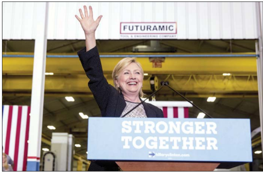
كلينتون ملوحة مؤيديها خلال تجمع انتخابي في ميشيغان

الخامسة. وفي هذا الصدد، أعلنت شبكة «ان.بي.سي» نتائج استطلاع أجرته مع مؤسسة «ماريسيت كوليج» أسفر عن نتائج واضحة لصالح كلينتون، حيث تقدمت على ترامب بفارق 5 نقاط مئوية في فلوريدا و9 نقاط في نورث كارولينا، و13 في فيرجينيا و14 نقطة مئوية في كولورادو. والسؤال الذي يتربد الآن بلا توقف في أجهزة الإعلام الأميركية عند تناولها للانتخابات الرئاسية هو ما اذا كان ترامب سيتمكن من قلب الطاولة ومحو آثار اسبوع من التصريحات المستفزة بدأت بالسخرة من اسرة سائلة فقدت ابنها في حرب العراق وانتهت باتهام الرئيس باراك اوباما والمرشحة الديموقراطية للانتخابات الرئاسية هيلاري كلينتون بالأسلوبية عن تأسيس تنظيم داعش قبل