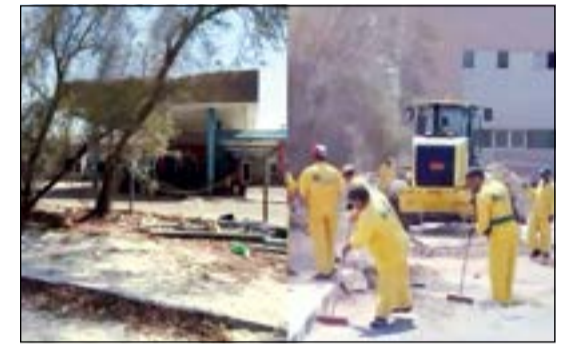
إزالة إعلان مخالف