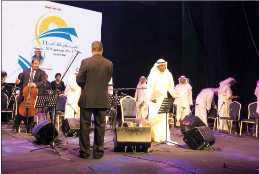
جانب من الحفل في مسرح الدسمة

الكثيرون، يأتي في اطار دعم المجلس لفئة الشباب ملء أوقات فراغهم وإبراز إبداعاتهم.