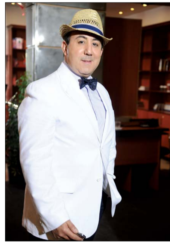
محمد خير الجراح

ستكون أحداثها مشوقة ومغابرة للأجزاء السابقة؟. وعن أسباب زيارته بالفترة القليلة الماضية لدولة الإمارات العربية المتحدة، قال: كنت أسجل أغنيات باستديو «شيرو منان»، وبسؤاله هل هناك عمل درامي خليجي جديد، اجاب: هناك شبه اتفاق على عمل جديد في دولة الإمارات العربية المتحدة من إنتاج شركة «كلايكت». وعندما سألته «الأنباء» هل يقصد «الحرملك» للمخرج سيف الدين سبيعي، رد خير الجراح: سأحدث لـ «الأنباء» عندما أوقع العقد، لكنه عاد وأكد أن هناك إحداثاً جديدة تظراً على شخصية «أبو بدر» في مسلسل «باب الحارة»، والتي تزامنت مع الثورة التي بدأت أحداثها بأحياء دمشق.