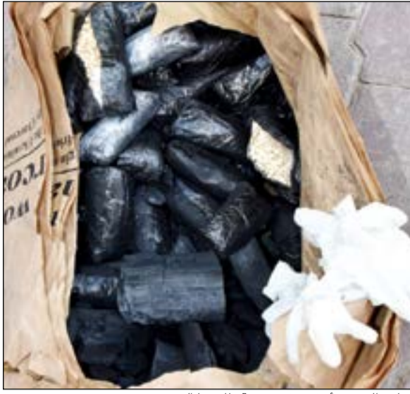
اكياس الحبوب اخفيت في شحنة ظاهرها الفحم