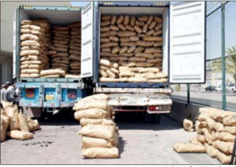
اكياس الفحم المغمومة داخل الحاويتين