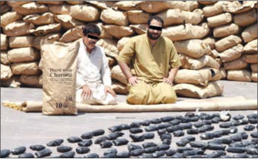
المتهمان السوري والخليجي امام المضبوطات