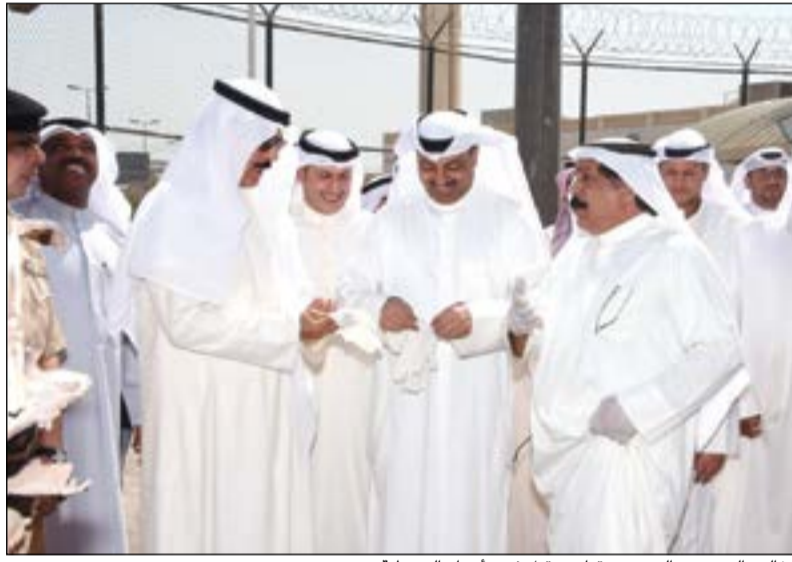
الخالد والعوضي والدرعي وقبارزة قبل فض أحرار الضبطية