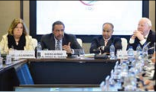
الشيخ أحمد الفهد مترسدا لاجتماع اتحاد اللجان الأولمبية الوطنية (أنوك)