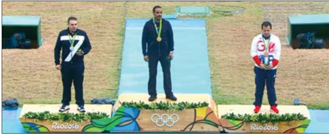
فهد الديحاني على منصة التتويج

رفع البطل الرامي فهد الديحاني اسم الكويت والعرب عاليا في أولمبياد ريو رغم مشاركته تحت العلم الأولمبي بعد إحرازه الميدالية الذهبية في منافسات الدبل تراب» بعد فوزه بنتيجة 28 نقطة مقابل 27 للإيطالي ماركو إنوشنتي، ليهدي الكويت والعرب أجملة هدية ويثبت أن الأمل التي كانت معقودة عليه كانت في محلها حيث رسم الفرحة على محيا كل الكويتيين وأكد للجميع أن الرياضة الكويتية في بلدنا الغالي مازالت منبعها للنجوم