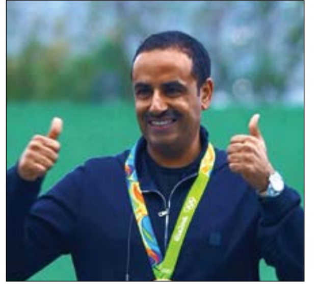
السعادة على وجه الديحاني بعد حصوله على الميدالية الذهبية