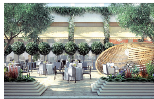
جزء من منطقة الجاردنز