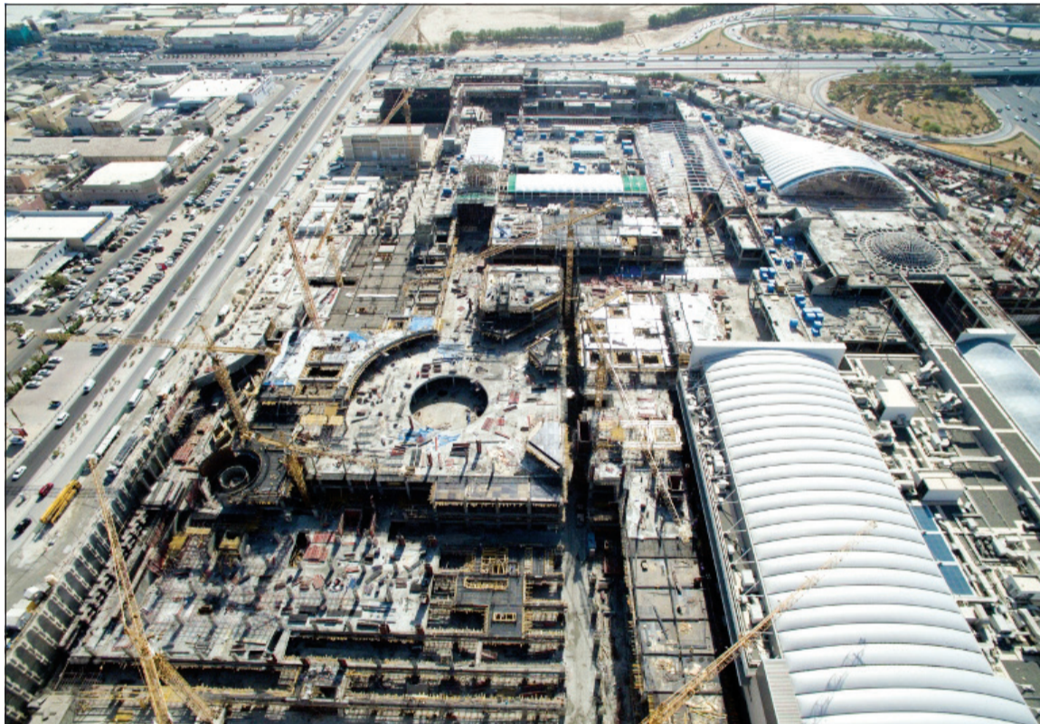
لقطة موقع إنشاء المرحلة الرابعه للمشروع

أعلنت شركة المباني المالكة للأفنيوز، أن نسبة الإنجاز للمرحلة الرابعة من الأفنيوز وصلت الى 52٪، تتضمن مساحة تجارية تبلغ 95 ألف متر مربع، بتكلفة تقديرية تصل الى 265 مليون دينار (900 مليون دولار) لتصل التكلفة الاجمالية للمشروع بكل مراحله الى 600 مليون دينار (2 مليار دولار) وذلك لإثراء الأفنيوز كأحد أبرز وجهات السياحة والتسوق الأكثر تنافسا في الشرق الأوسط، والذي سيعزز بدوره من الجهود الخاصة بدعم الترفيه والسياحة والتسوق في الكويت.