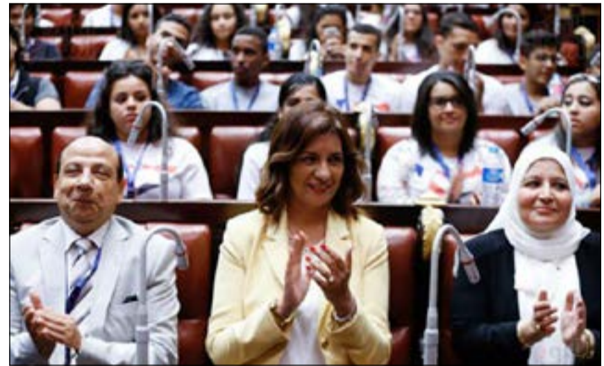
السفيرة نبيلة مكرم وزيرة الهجرة ونواب البرلمان أثناء اجتماعهم مع الجالية المصرية بفرنسا

وكالات: قالت نبيلة مكرم، وزيرة الهجرة وشؤون المصريين بالخارج، أن هناك بعض المواقع التي تنشر أخباراً مغلوطة بهدف النيل من الشعب المصري بالخارج وتشويه صورة البلد، وتضرب مشدداً على الاستقرار وانتشار الفوضى في البلاد، وهذه الأخبار جميعها مغلوطة ولا أساس لها من الصحة، وعلى أبناء مصر في الخارج توضيح هذه الصورة الخاطئة.