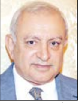
د. عبد العيسى

من هذه الكوادر في مناطق أشد حاجة ولعدم فتح باب التعيين أو التعاقد وتحديد مادة التربية الإسلامية بنات، وبناء على ما تقتضيه مصلحة العمل تقرر إلغاء القرار الوزاري رقم 191/2014 بشأن نقل المعلمات من سكان مدينتي الخفجي وحفر الباطن على أن تتم الاستعانة بالمعلمات حسب حاجة المناطق التعليمية ويستتفي منهن في النقل زوجات الكويتيين. وأشار العيسى في قراره إلى أن النقل يتم حسب الأحدث في التعيين مشددا على عدم تكليفهن في حالة النقل بالتدريس في الحصة الأولى. هذا، وأصدر وكيل وزارة التربية بالإنابة فهد الغيص نشرة عامة بشأن منح الإجازة الخاصة لأداء فريضة الحج لسنة 1437 - 2016 جاء فيها ألا يكون طالب إجازة الحج قد سبق حصوله على هذه الإجازة ويتحمل المسؤولية القانونية كاملة في حالة ثبوت حصوله عليها خلال عمله بالوزارة أو في أي جهة حكومية أخرى. وأن يكون قد أتم ستة ميلادية على الأقل في خدمة الدولة بالنسبة للكويتي وستين تعاقديتين لغير الكويتي.