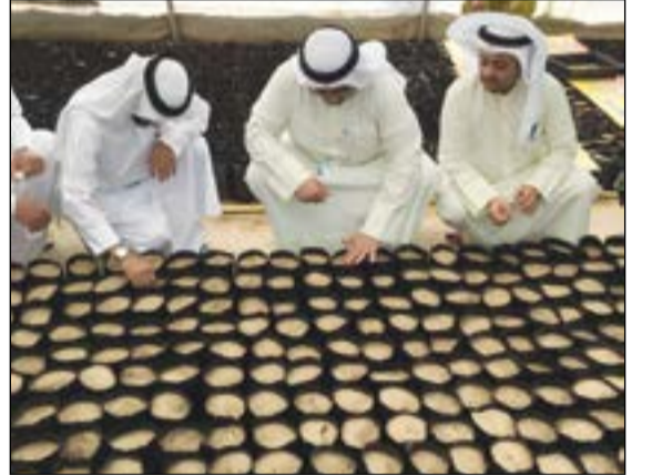
الحجرف يتفقد الشتلات