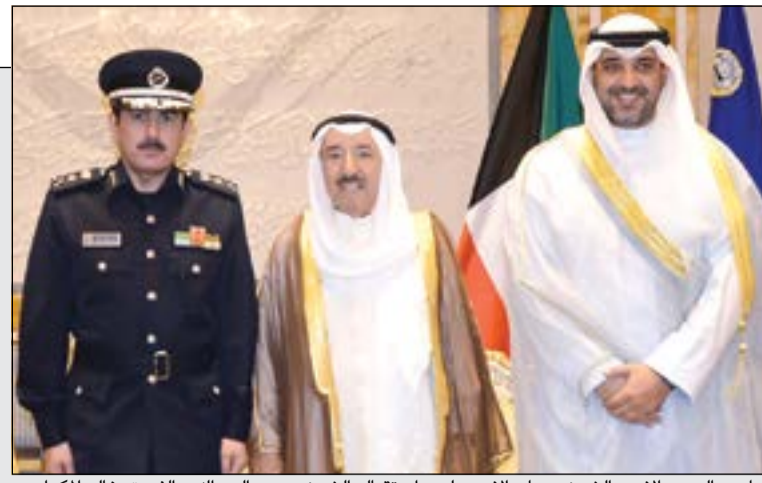
صاحب السمو الأمير الشيخ صباح الأحمد لدى استقباله الشيخ محمد العبدالله والفريق خالد المكرام

العبدالله قدم لصاحب السمو الفريق خالد المكرام بمناسبة تعيينه مديراً عاماً لـ «الإطفاء»