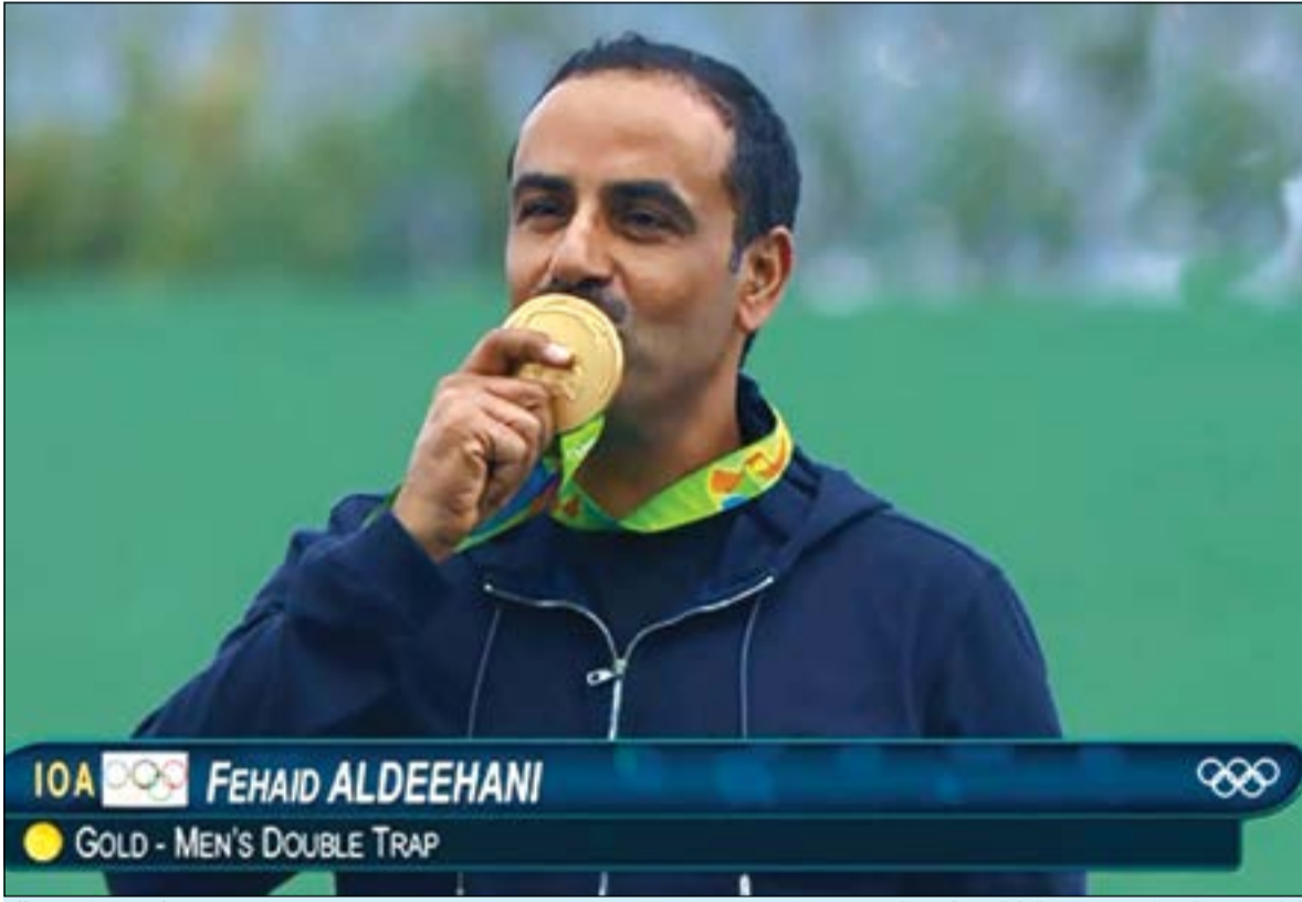
الرامي فهد الديحاني يقبل الميدالية الذهبية بعد التتويج (صورة تلفزيونية)

أحرز ذهبية الـ «دبل تراب» بعد أن تغلب على الإيطالي ماركو إنونشتي الديحاني من ذهب في ريو 2016