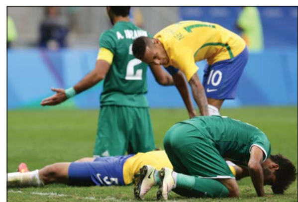
نيمار مطالب بحمل بلاده للدور المقبل

يسعى المنتخب الأولمبي العراقي إلى حسم تأهله إلى الدور ربع النهائي لمسابقة كرة القدم في دورة الألعاب الأولمبية المقامة حاليا في ريو دي جانيرو، وذلك عندما يلاقي جنوب أفريقيا اليوم في الجولة الثالثة الأخيرة من منافسات المجموعة الرابعة. ويملك العراق نقطتين وهو الرصيد ذاته الذي تملكه البرازيل التي ستواجه الدنمارك المتصدرة بربع نقاط، وفوز أسود الراقدين سيمنحهم بطاقة التأهل بغض النظر عن نتيجة المباراة الثانية. ويعول العراقيون على المعنويات العالية للاعبين عقب الأداء المتميز أمام نجم برشلونة الإسباني نيمار دا سيلفا ورفاقه، كما يهدفون إلى استغلال المعنويات المهزوزة للاعبين جنوب أفريقيا عقب الخسارة أمام الدنمارك في الجولة الثانية. ولن تكون جنوب أفريقيا لقمة سائغة أمام العراق خصوصا أن حظوظها لاتزال قائمة في حال كسبها النقاط