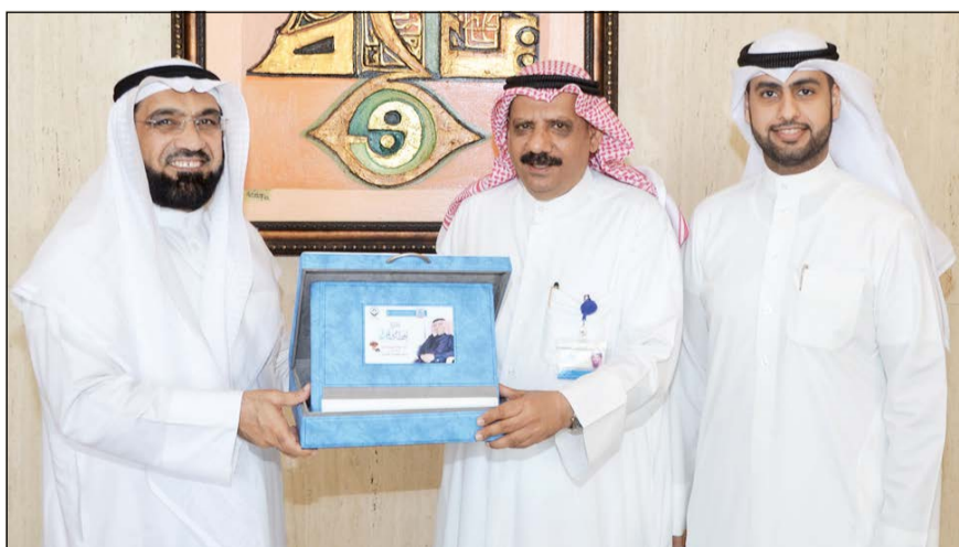
جانب من تكريم «الدولي»

والمجالات الدينية، الإنسانية، الاجتماعية، الخيرية، الرياضية، الصحية والطبية، الوطنية، الثقافية، التعليمية وغيرها.