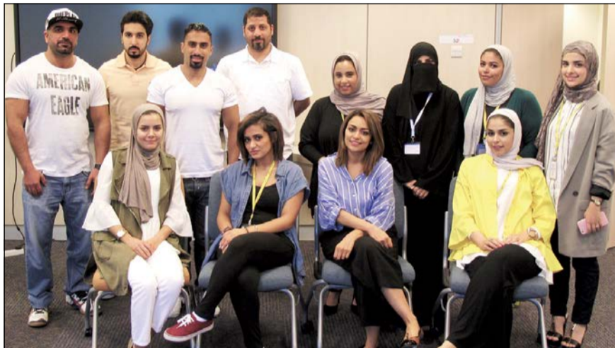
موظفو البنك الأهلي مع ممثلي الحملة الوطنية للتوعية بالإسعافات الأولية

بالمهارات اللازمة مثل الإسعافات الأولية. ويحرص البنك الأهلي الكويتي على تقديم فرص التدريب على الإسعافات الأولية لموظفيه من خلال ثلاث دورات تدريبية للإسعافات الأولية هذا العام.