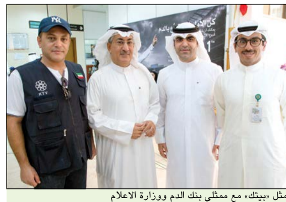
ممثل «بيتك» مع ممثلي بنك الدم ووزارة الاعلام

شارك بيت التمويل الكويتي «بيتك» بالحملة الوطنية للتبرع بالدم التي أطلقتها بنك الدم المركزي التابع لوزارة الصحة، ضمن إطار المسؤولية الاجتماعية للبنك ودوره بالمساهمة في رفع الوعي الصحي، وتعزيز مخزون بنك الدم الرومي، وإبراز أهمية التبرع بالدم اجتماعياً وصحياً، لدوره في مساعدة المرضى الذين يحتاجون إليه. وجاء تنظيم حملة التبرع بالدم التي انطلقت تحت شعار «تبرعك بالدم صدقة لك وحياة لغيرك.. فكن وأهيا للحياة وقوة لغيرك»، تزامناً مع ذكرى الغزو العراقي على