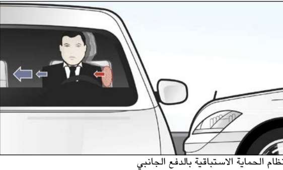
نظام الحماية الاستباقية بالدفع الجانبي

نظام الحماية الاستباقية الصوتي مع نظامها الصوتي الجديد للحماية الاستباقية، توظف مرسيدس-بنز لأول مرة ردة الفعل الطبيعية لتهيئة آذان الركاب لاستيعاب الضجيج المرتفع الذي يصدر عادة مع وقوع الحوادث، ويستند النظام إلى حقيقة أن العضلة الرقابية في آذاننا تستجيب للضجيج الصاخب من خلال الانقباض بدرجة فعل لا إرادية. ويؤدي تقلص هذه العضلة الصغيرة لتغيير الرباط بين طبلة الأذن والأذن الداخلية، مما يوفر حماية أكبر ضد