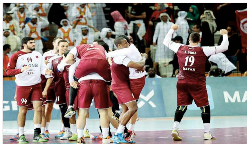
الأمل كبيرة على المنتخب القطري لكرة اليد

(10 كيلومترات)، علما انه سيخوض السباقين خلال أولمبياد ريو.