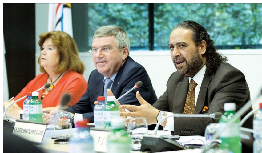
الشيخ أحمد الفهد يعلن دعمه الكامل للجنة الأولمبية

فيه مصلحة اللجان الأولمبية الوطنية والرياضيين والحركة الأولمبية بأسرها، ونعتقد أن تأجيل الدورة الى 2019 سيأتيح لنا فعل ذلك. وتابع: أن دورة الألعاب الأولمبية العالمية التي تنظمها أنوك هي جزء من رؤية أنوك البعيدة المدى لتعزز الدعم والفرص التي يمكن تقديمها للجان الأولمبية الوطنية والرياضيين، وخصوصا بشأن إشراك المزيد من الشباب في مجال الرياضة. ان نقل الدورة الى 2019 لن يعود بالنفع فقط على اللجان الأولمبية الوطنية ورياضيها، ولكن بمنهجهم المزيد من الوقت للاستعداد للحدث يمكننا ان نضمن ان الملايين من المشاهدين حول العالم سيستمعون بأداء رائع.