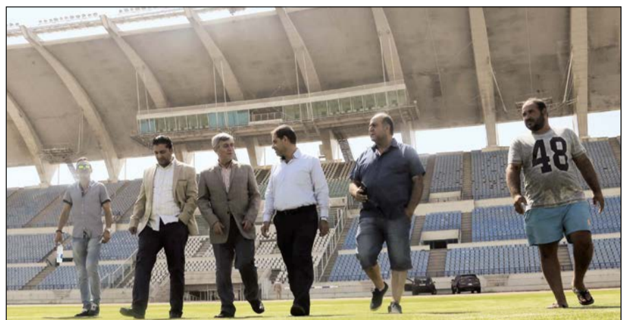
جولة تفقدية للملعب الرئيسي في مدينة كميل شمعون