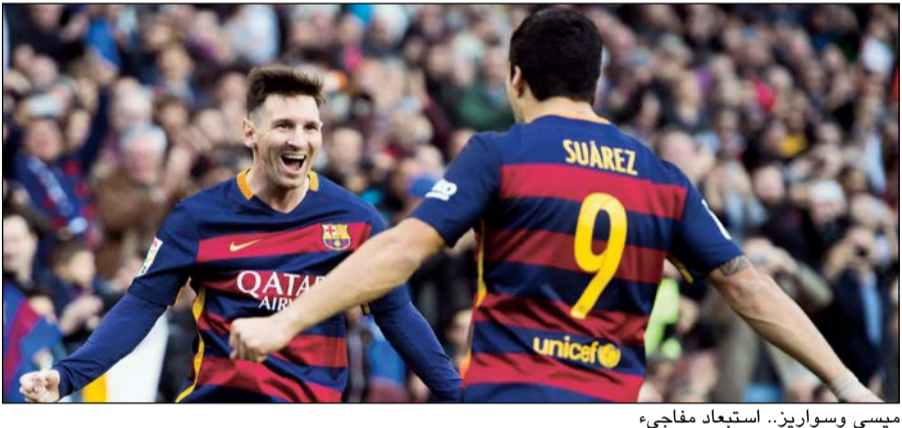
ميسي وسواريز.. استبعاد مفاجئ

أصوات والذين سيتنافسون على الجائزة. وحل لاعبا برشلونة، ميسي وسواريز، في المركزين الرابع والخامس على الترتيب، يليهما حارس يوفنتوس الإيطالي، ثم جيانلويجي بوفون، ثم البرتغالي بيبي لاعب الريال سابعا، وأكمل القائمة الألمان مانويل نوير وتوني كروس وتوماس مولر. وستكون هذه النسخة السادسة للجائزة، التي تسلم منذ 2011، ويعد ميسي لاعب برشلونة أكثر الفائزين بها (مرتين) في 2011 و2015، إضافة