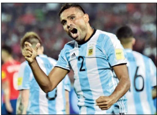
غابرييل ميركادو يخوض تجربة جديدة في إسبانيا

أعلن نادي إشبيلية بطل الدوري الأوروبي لكرة القدم عن تعاقد مع الظهير الأيمن الأرجنتيني الدولي ولاعب ريفر بلنت غابرييل ميركادو لمدة 3 سنوات دون الكشف عن قيمة الصفقة. وكان اللاعب (29 عاما) ضمن تشكيلة الأرجنتين التي شاركت في كأس كوبا أميركا المؤدية في يونيو الماضي حينما خسرت منتخب بلاده في النهائي بركلات الترجيح أمام تشيلي. ونقل موقع النادي الإسباني على الإنترنت عن ميركادو قوله «حدث كل شيء بسرعة شديدة وأشعر بالقلق، إنه يومي الأول، احترت الفحوص الطبية، ووقعت العقد، وهذه ستكون أول حصة تدريبية لي مع زملائي في الفريق». وتعاقد إشبيلية مع ميركادو ليكون بديلا للمدافع كوكي الذي انتقل إلى شالكه الألماني يوم الأربعاء الماضي. ويواجه إشبيلية، بقيادة مديره الجديد خورخي سامباولي، مواطنه ريال مدريد بطل دوري أبطال أوروبا في كأس السوبر الأوروبية في مدينة تروندهايم النرويجية يوم الثلاثاء المقبل.