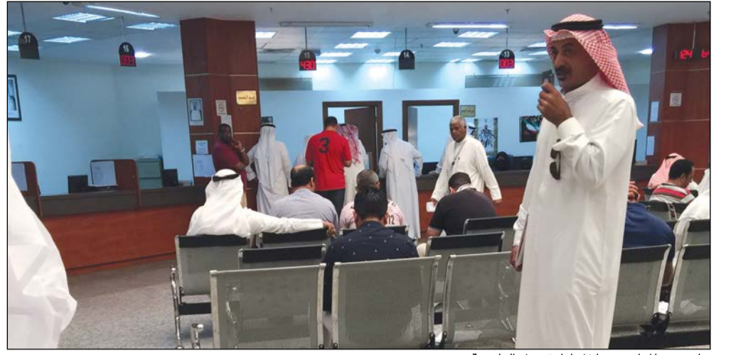
جانب من المراجعين داخل إدارة عمل العاصمة

أصحاب الأعمال أشادوا بتخصيص صالات خاصة لهم لإنهاء كل إجراءاتهم