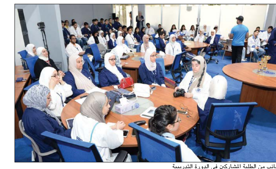
جانب من الطلبة المشاركين في الدورة التدريبية

تظمت دائرة تنمية القوى العاملة بمعهد الكويت للأبحاث العلمية مسابقة «إبداعات شبابية» التابعة لفعاليات الدورة التدريبية الصيفية الـ 39 للمرحلتين الثانوية والجامعية تحت شعار «الشباب وعي وثقافة»، وأوضحت مديرة الدورة د. نرجس بيل أن أهداف المسابقة تدور حول طرح الطلبة لمشروعات وأفكار إبداعية، ووضع حلول للمشاكل والتحديات التي تواجه الكويت، ومن هذه المشاريع: مشروع الطاقة البديلة، ومشروع المساحة (جزيرة الشراع) في الكويت، ومشروع المدرسة الذكية، وأيضا مشروع الهندسة الميكانيكية، ومشروع العدسات المساعدة، ومشروع إعادة التدوير، ومشروع وزارة الداخلية، ومشروع الفيزياء، بالإضافة إلى مشروع المياه المعالجة. كما أشارت د. بيل إلى أنه تم تشكيل لجنة تحكيم للمشاريع من عدة جهات خارجية منها: مؤسسة الكويت للتقدم العلمي، والصندوق الكويتي للمشاريع الصغيرة، ومركز صباح الأحمد للموهبة والإبداع، ووزارة الصحة، وكذلك باحثو المعهد وأعلنت حصول مشروع إعادة التدوير على المركز الأول، بينما حصل مشروع العدسات المساعدة على المركز الثاني، في حين مشروع السياحة في الكويت (جزيرة الشراع) حصل على المركز الثالث.