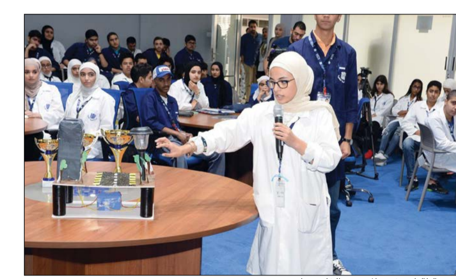
إحدى الطالبات تشرح الموضوع الخاص بها