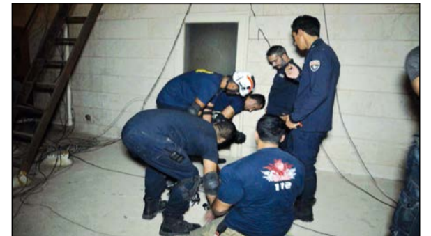
رجال الإنقاذ يخرجون الخادمة