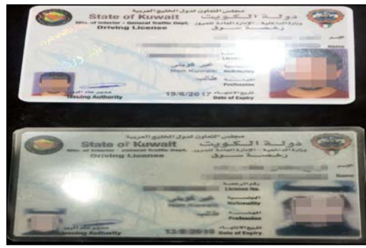
صورة البطاقة المدنية للمتهمين في القضية

على محل إقامته في منطقة جابر الاحمد، وكان يضربه ايضا حينما يمزح معه. وأضاف المصدر: فور الاستماع إلى افادات الطفل وتوثيقها، تم إبلاغ وكيل النائب العام الذي أمر باضافة شقيق صديق الام إلى قائمة المتهمين، وانتقلت قوة من مباحث العاصمة إلى حيث يقبع المتهم الثاني في منطقة تيماء وجرى ضبطه واقر بأنه كان يزور صديقة شقيقه، الا انه نفى ان يكون قد ضرب الطفل.