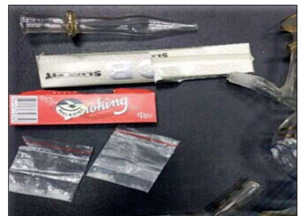
الشبو أخفاه الوافد في لغافات