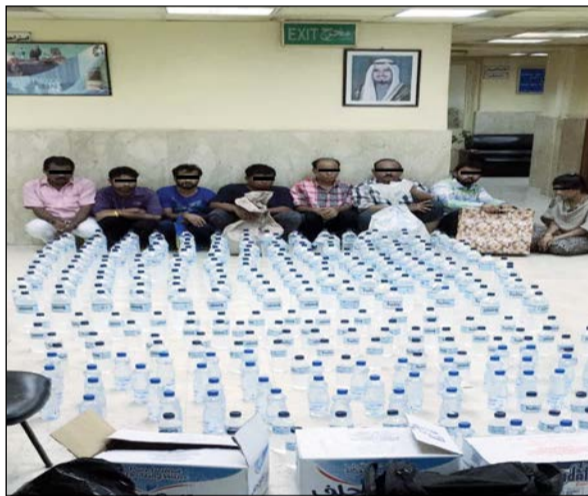
الخمور المضبوطة بالفروانية