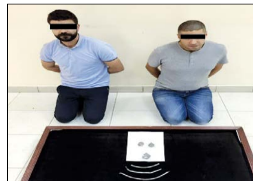
التونسي واللبناني وامامهما المضبوطات

لمادة الماريغوانا وعليه تم تشكيل فريق عمل واستدراج لصققة قوامها 20 غرام ماريغوانا، وجرى الاتفاق على ان يكون التسليم والتسليم إلى جوار مدرسة في منطقة الجليب، ويمجرد حضور المتهم تم القبض عليه بموجب اذن صادر عن النيابة العامة وبتفتيش مسكنه عثر بداخله على نحو 2 كيلو ماريغوانا واعترف باتجاره في المخدرات وزود رجال المباحث بمعلومات تساعد