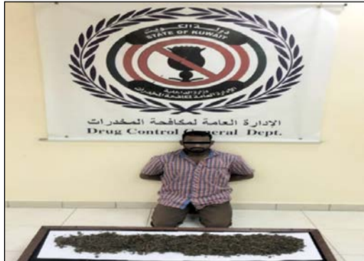
البنغالي وامامه الماريغوانا

في ضبط وافد آخر مجهول باعه هذه السموم المخدرة. وفي منطقة ميدان حولي وردت معلومات عن شاب تونسي يروج للمخدرات حيث تم التنسيق مع النيابة العامة واستدراجها إلى بيع اصعب من الحشيش وضبط وارشاد عن زميله في الاتجار وهو وافد لبناني وبتفتيش محل سكنهما عثر على 200 غرام حشيش و5 غرامات كوكايين واعترفا بالاتجار في المخدرات وتعاطيها.