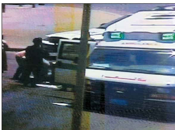
رجال الاسعاف خلال انقاذهم الواصل المدموم