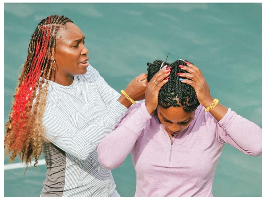
فينوس وليامس تساعد شقيقتها سيرينا في ترتيب تسريحتها

تجنبت اسطورة التنس الاميركية سيرينا وليامس التحدث من المركز الاعلامي لاولمبياد ريو 2016 عن منافستها الروسية ماريا شارابوفا التي تغيب عن الألعاب لإيقافها بسبب تناولها مادة محظورة. وتحدثت سيرينا قائلة: «من المميز دائما ان تكون جزءا من الألعاب الأولمبية وهذا من الاسباب التي تدفعنا للقتال بشراسة من اجل محاولة العودة إلى الألعاب والفوز بميدالية من اجل بلدنا». واعتبرت سيرينا ان الجميع يحلم بإحراز لقب بطولات الغرايد سلام الاربعة «تم تاتي بعد ذلك الألعاب الأولمبية، اللعب في الالعاب الأولمبية مختلف تماما لانك تلعب حقا من اجل بلدك، عندما حملت ميداليتي الذهبية الأولى لم اتوقع ان يخالجنني ذلك الشعور الغريب، والسبب يعود الى ان هناك الكثير من الرياضيين الرائعين المشاركين من جميع أنحاء العالم في كل الرياضات». وأضاف سيرينا التي ستكون مرشحة فوق العادة لاحتفاظ بذهبية الفردية والزوجي ايضا: «لقد حصلت حقا على فرصة الاستمتاع وتقدير الذهبية التي