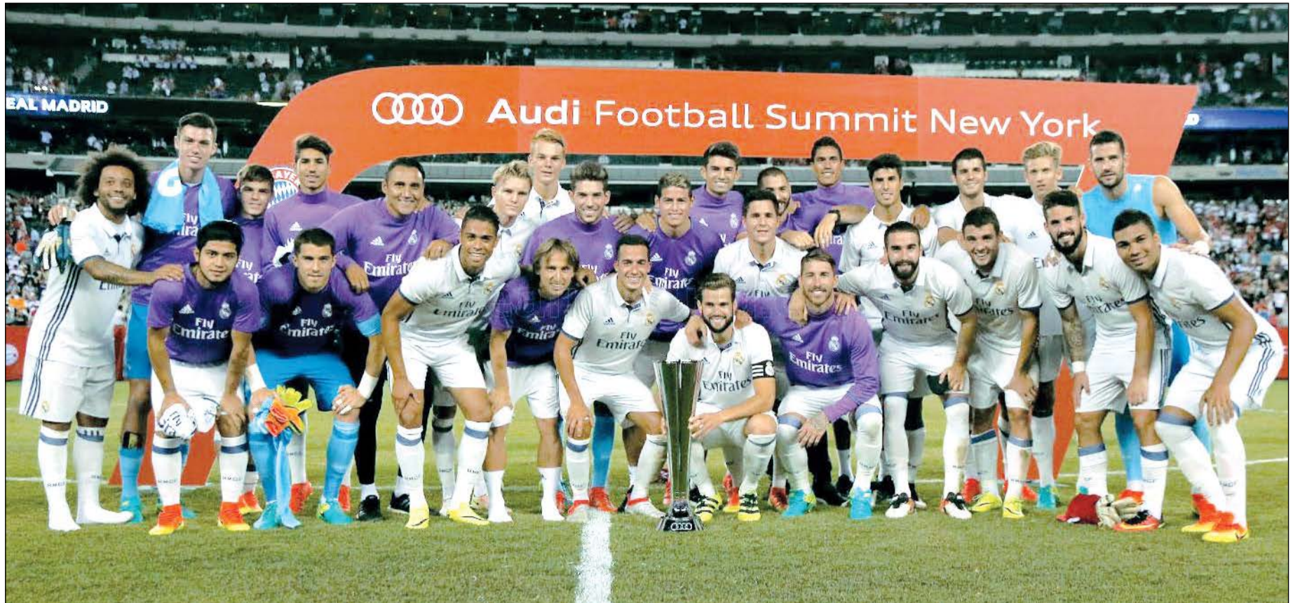
لاعب ريال مدريد وأمامهم كأس أودي