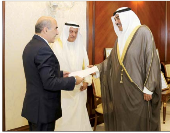
الشيخ صباح الخالد خلال تسلمه أوراق اعتماد السفير القبرصي