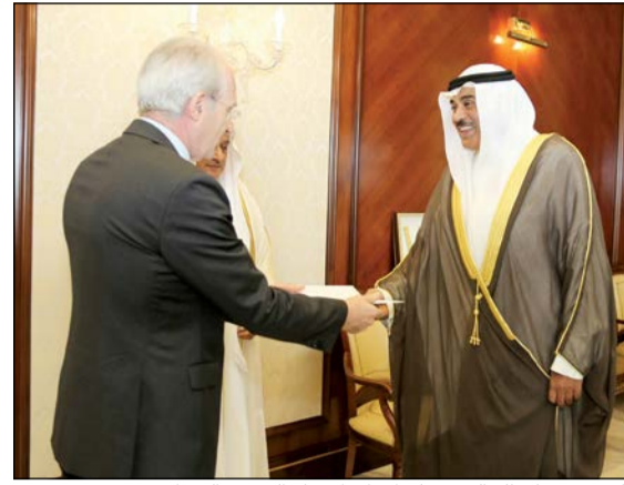
الشيخ صباح الخالد يتسلم أوراق اعتماد السفير اليوناني

تسلم النائب الأول لرئيس مجلس الوزراء ووزير الخارجية الشيخ صباح الخالد نسخة من أوراق اعتماد سفير جمهورية الكويت أندرياس باباداكيس وذلك خلال اللقاء الذي تم صباح امس في مقر ديوان عام وزارة الخارجية. وتمنى الشيخ صباح الخالد للسفير الجديد التوفيق في مهام عمله وللعلاقات الثنائية بين البلدين الصديقين المزيد من التقدم والازدهار.