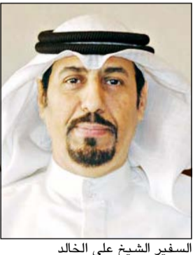
السفير الشيخ علي الخالد

ونوه رئيس الجمعية الشعبية الإيطالية التي نشأت للتضامن مع شعب الكويت ومستاندة حقوقه وحرية واستقلاله عقب الاحتلال بهذه المناسبة بتضحيات الكثير من شهداء الكويت والحرية من المدنيين والعسكريين الذين بذلوا أرواحهم الغالية دفاعا عن وطنهم. وأضاف أنه «في مقابل هجمات الإرهاب العنيف في أنحاء كثيرة من العالم والأزمات العديدة المتساقطة المتناججة التي ما زالت تنتظر حلولاً سياسية عادلة تؤكد الحاجة لالتزام دولي متجدد قوي من قبل جميع الدول وتلك الحكومات الحريصة على كرامة الإنسان وحقوقه».