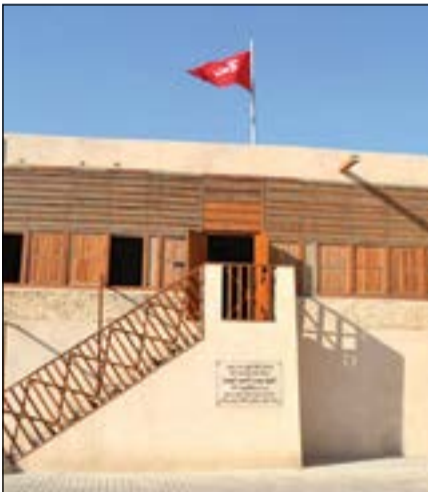
متحف كشك الشيخ مبارك