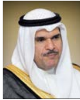
الشيخ سلمان الحمد

الجوائز التشجيعية للشباب 500 دينار للإنجازات المحلية و1000 للإقليمية و1500 للدولية