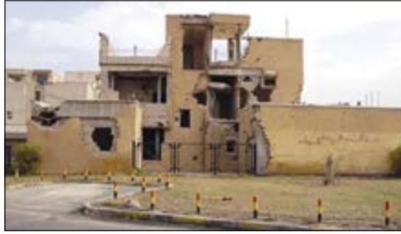
متحف شهداء القرنين

الشعبية التي تعبر عن الحياة قديماً في الكويت، مبني متحف آثار فيلكا: يعرض فيه بعض المكتشفات الأثرية التي اكتشفتها البعثة الدنماركية في جزيرة فيلكا، ومبنى القبة السماوية: متحف الفن الحديث: كان يشغل مبنى المدرسة الشريفة التي انشئت في العام 1938 كمدرسة للبنين، وهي احدى اقدم واعرق المدارس الكويتية، تحول إلى مزار للمعارض التشكيلية والتصوير. ● متحف الكويت الوطني، ويضم مبنى المتحف الشعبي: يضم الأثار