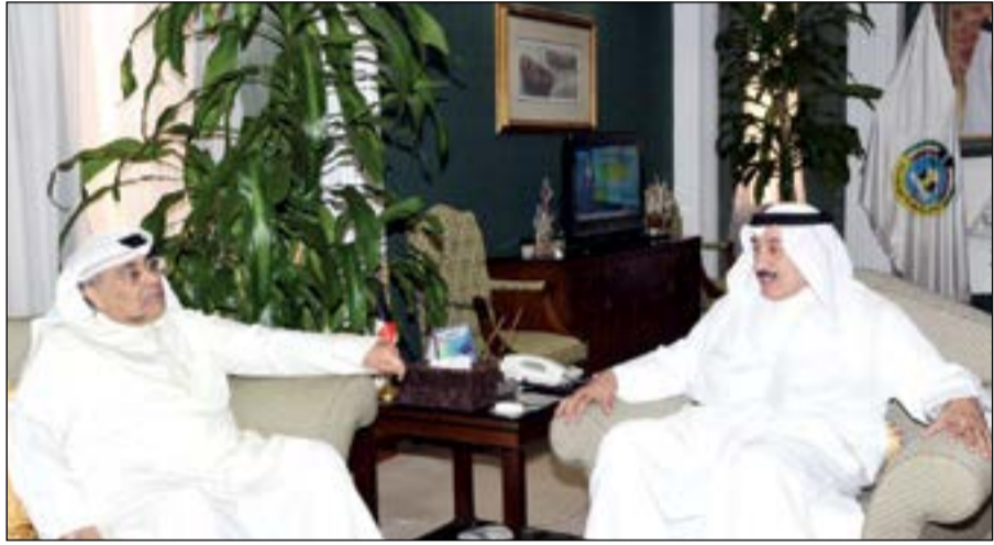
الفريق ركن م. فهد الأمير خلال لقائه فيصل المقصد

المصاحبة للعملية التعليمية. وأوضح أنه لمس تعاوناً كبيراً من قبل محافظ الجهاد الذي أكد تسخير كل الإمكانيات في خدمة المجتمع وأبناء المحافظة وفق رؤية مستقبلية تعنى برعاية الشباب، مبيناً أنه ستكون هناك نشاطات مماثلة وزيارات ميدانية لبقية محافظات البلاد بهذا الشأن وكانت البداية في الجهاد.