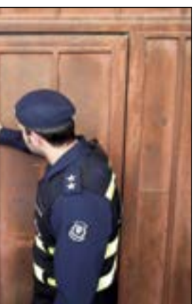
إنداز بالغلق لإحدى المنشآت

بالتفكير الإداري لمنشآت تعتبر شديدة الخطورة ومدة الإنذار 72 ساعة بعدها يتم غلقها إدارياً إذا ما أزيلت جميع هذه المخالفات، وشدد المكرد بأن الإدارة العامة للإطفاء لن تتهاون بتطبيق القانون على