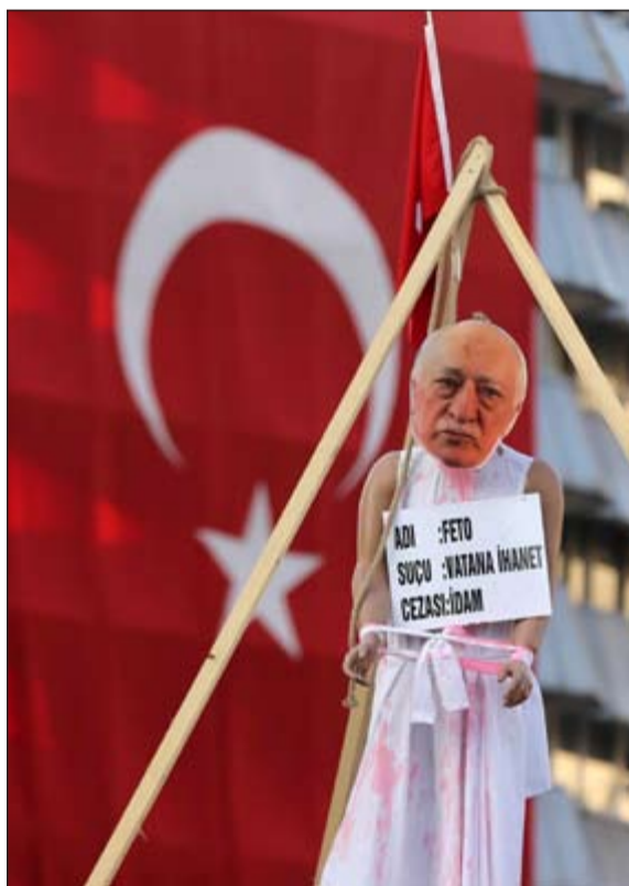
رعية على حبل المشقة تمثل رجل الدين فتح الله غولن المتهم الاول بالانقلاب

لكن الوزير التركي اكد ان سعر صرف الليرة التركية بقي مستقرًا نسبياً ولم يتم بعد مراجعة ارقام الصادرات او النمو الاقتصادي. من جانبه، قال وزير العدل التركي بكر بوزداغ في مؤتمر