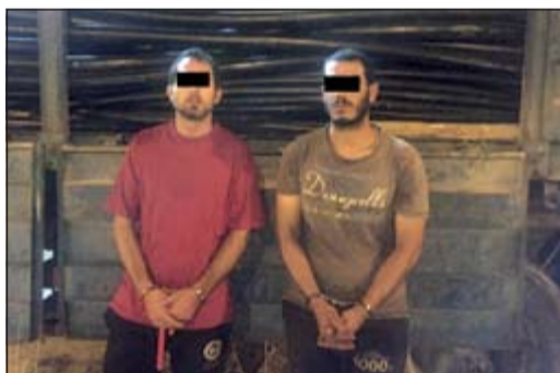
للصان وخلفهما المسروقات

أفاد بأنها تخص وافداً إيرانياً من مواليد 1981، وعليه تم رصده وضبطه وبسؤاله عن الكيبلات أفاد بأنها تخصه ويمك مستندات وزارة المواصلات لتمديد الكيبلات.