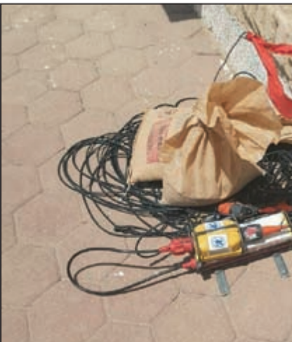
الاسلاك المثيرة للاشتباه

تمكن رجال الإدارة العامة للمباحث الجنائية (مباحث الجهراء) من ضبط شاحنة محملة بكمية كبيرة من الكيبلات تبين فيما بعد انها مسروقة من أحد المستودعات في ميناء عبدالله، وكان رجال مباحث الجهراء وخلال قيامهم بدورية لييلية في منطقة امغرة اشتبهوا بشاحنة (قارطة ومقطورة) محملة بكمية كبيرة من الكيبلات، حيث تم استيقافها وطلب اثباتات السائق الذي تبين انه مصري من مواليد 1981، وبسؤاله عن حمولة الشاحنة