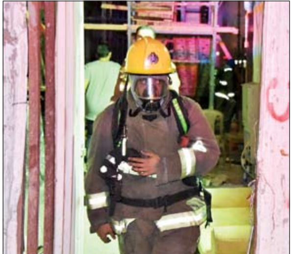
أحد رجال الاطفاء يبحث عن أدلة تفيد التحقيق