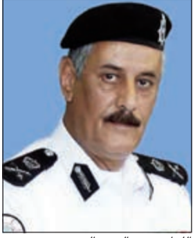
اللواء زهير النصرالله

أعلن وكيل وزارة الداخلية المساعد لشؤون أمن الحدود البحرية اللواء زهير النصرالله عن آلية عمل جديدة تنظم حركة دخول وخروج سفن الصيد الكويتية إلى خارج المياه الإقليمية الكويتية تسمح بمرور السفن الراغبة في الصيد في المياه الدولية على منفذ جزيرة أم المرادم اعتباراً من يوم الأحد الموافق 2016/8/7.