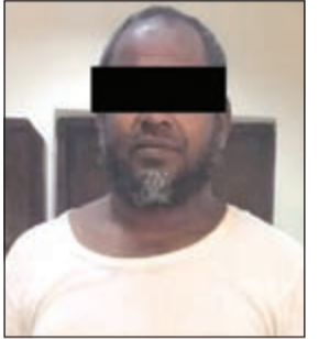
المخالف ضبط في النويصيب

أمر مدير أمن محافظة الأحمدى العميد عبدالله سفاوح بإحالة وافد بنغالي إلى الإبعاد الإداري وسرعة إبعاده عن البلاد وإدراج اسمه على قوائم المنع من الدخول إلى البلاد مجدداً بعد أن ضرب الرقم القياسي في مخالفة قانون الإقامة لمدة 19 عاماً. وبحسب مصدر أمني فإن إحدى دوريات أمن الأحمدى وخلال جولة لها من التوزيع أوقفت وافداً للإطلاع على هويته، حيث زعم أن الهوية بحوزة كفيله ليتم تبصيمه ليكتشف رجال الدوريات أن الوافد مسجل في أجهزة حاسوب الداخلية باعتباره مخالفاً لقانون الإقامة منذ 19 عاماً.