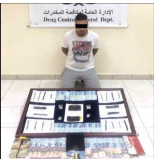
المتهم وأمامه المضبوطات

توالت ضربات الإدارة العامة لمكافحة المخدرات على تجار السموم المخدرة، إذ ضبط يوم امس وفد من جنسية عربية بحوزته كيلو حشيش و150 غراما من الشبو، وحسب مصدر امني فإن معلومات تلقاها مدير عام مكافحة المخدرات بالنيابة العميد وليد الدريعي تفيد بوجود وفد من جنسية عربية يقوم ببيع المخدرات في منطقة الفردوس، حيث أمر رجاله بعمل التحريات وسرعة ضبطه، وقام مدير