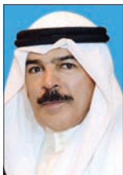
الشيخ محمد الخالد

أصدر نائب رئيس مجلس الوزراء ووزير الداخلية الشيخ محمد الخالد، قراراً نص في مادته الأولى على: أولاً: يستحدث منصب بسمي (وكيل الوزارة المساعد للشؤون الإدارية) ويتبع وكيل الوزارة، وإدارة مكتب وكيل الوزارة المساعد للشؤون الإدارية والإدارة العامة للشؤون الإدارية ومركز التدريب