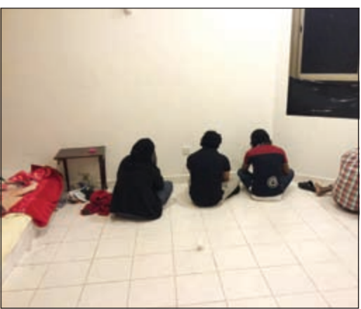
الوافدون الموقوفون في مصنع الخمور

تمكن أمن حولي من ضبط مصنع للخمور في منطقة حطين، وجاءت مدهامة المصنع بعد أن اشتبتهت دورية تابعة لأمن حولي كانت تتجول في منطقة حطين بوافدين من الجنسية الاسبوية يحملان بيدهما اكياسا سوداء وعند استيقافهما حاولا الهروب جريا على الاقدام وتم ضبطهما، وبتفتيش الاكياس تبين ان بها خمورا محلية، وعند سؤالهما اعترفا بأنهما يقومان ببيعها وأن مصدرها بيت بالمنطقة يوجد به مصنع خمور، وتم إبلاغ مدير الامن العميد عابدين العابدسين الذي أمر بإبلاغ النيابة، وعلى الفور تم إبلاغ النيابة واستخراج إذن من النيابة بالمدهامة، وعند مدهامة المنزل تم ضبط أفدة اسبوية من نفس الجنسية وعثر على 161 بطل خمر مسلي و291 برميلا و10 مصاف للضخ، وعليه تم تحويلهم إلى الجهات المختصة.