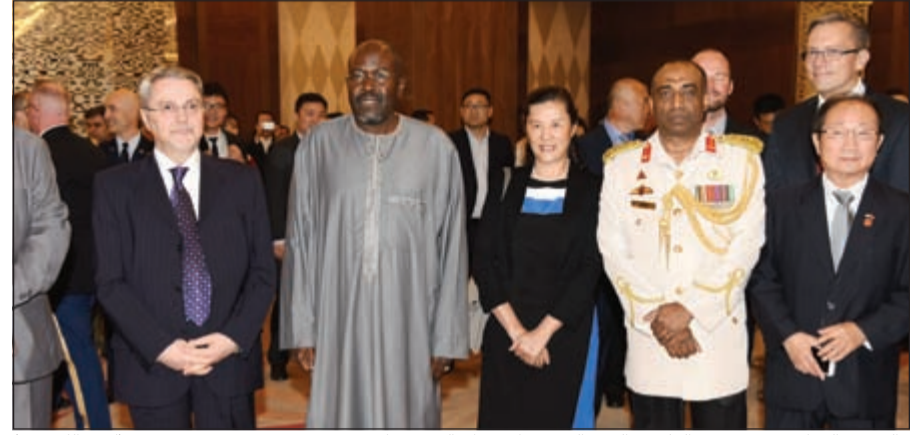
السفير العراقي محمد بحر العلوم والسفيري عبد الاحد امياكي يهتنان