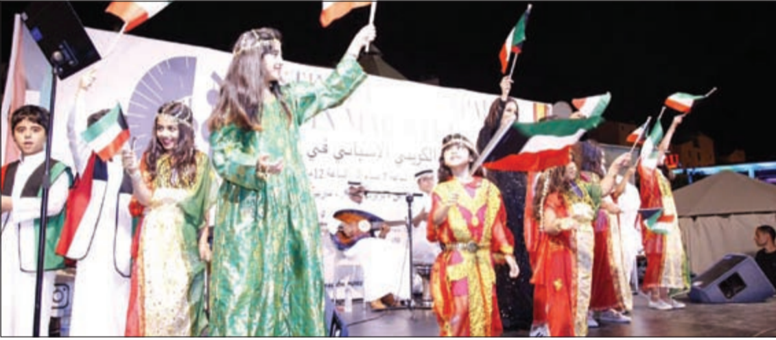
جانب من فعاليات المهرجان