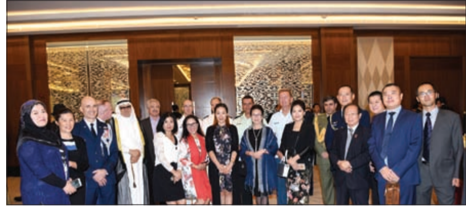
جانب من الحضور خلال الاحتفال

أسامة دياب أكد معاون رئيس الاركان العامة للجيش لهيئة الإدارة والقوى البشرية العميد ركن خالد الشمري على تطور أوجه التعاون المتميز بين الجيشين الكويتي والصيني منذ بداية العلاقات الدبلوماسية بين البلدين، والذي ظهر جليا في تبادل الدورات والخبرات العسكرية، بالإضافة إلى استفادة الجيش الكويتي من التكنولوجيا العسكرية الصينية. وأوضح الشمري في تصريحاته للصحافيين على هامش الحفل الذي أقامه الملحق العسكري الصيني بمناسبة يوم الجيش أول من أمس أن المدفق الصيني من أبرز مجالات التعاون العسكري بين البلدين والذي يعمل بكفاءة كبيرة منذ أن استخدمته الكويت عقب التحرير وحتى الآن، لافتا الى وجود لجان خاصة بين البلدين تبحث موضوعات الدورات التدريبية لعناصر القوات المسلحة مع تبادل الزيارات بين كبار الضباط في الجيشين.