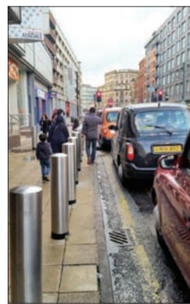
أحد شوارع المدينة العريقة

كما توجد جالية عريضة من اهل الشام وهم من ملل مختلفة (مسلمين ومسيحيين) واسسوا «الجمعية السورية المانشستر اوية» وهدفها خيرى وكانت تساعد النازحين بعد سقوط الخلافة العثمانية واسسسوا مدرسة لتدريس اجيالهم وانشأوا مسجدين في اربعينيات القرن الماضي ويقال انهم هم اول من اشترى كنيسة وحولوها في بريطانيا الى مسجد واليوم هناك اكثر من 6 ملايين سوري في الشتات!