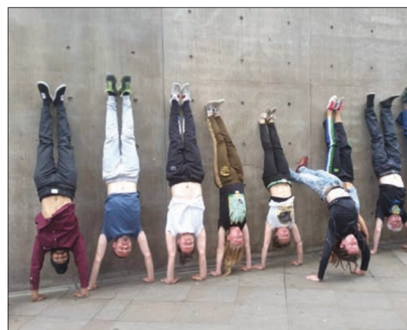
الشعب يعيش اللحظة