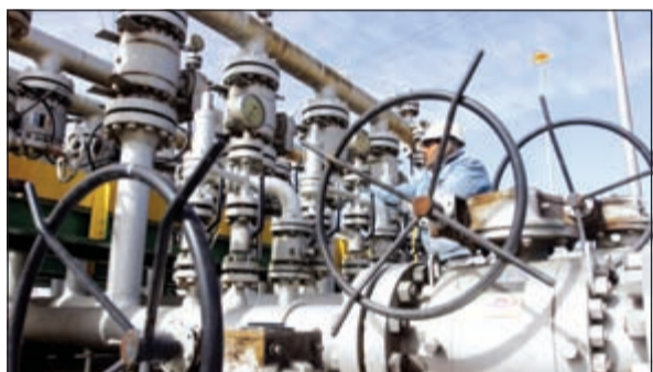
توقعات بأن يصل السوق الى حالة من التوازن في النصف الثاني من 2016

وتعتقد الوكالة ان المخزونات العالمية القياسية ومخزونات منظمة التعاون الاقتصادي والتنمية - الاوبس - ما زالت أعلى بنسبة 10٪ من المعتاد، كما ان توقعات السوق بانتعاش أسعار النفط الصخري الأميركي الى مستويات فوق 50 دولاراً للبرميل سيبقي عاملاً على إبقاء الأسعار دون ذلك المستوى، الى ان يؤدي العجز في عرض النفط الى تلاشي بعض المخزونات.