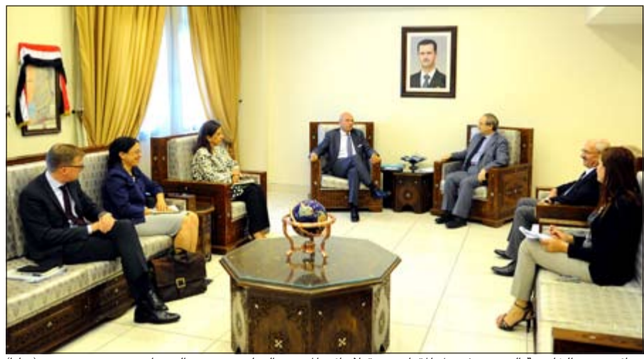
نائب وزير الخارجية السوري فيصل المقداد مستقبلاً نائب المبعوث الدولي رمزي عز الدين أمس (سانا)

في إطار الجهود الأممية بحثنا عن حل للقضية السورية، التقى مبعوث الأمم المتحدة لحل الأزمة ستافان ديمستورا في طهران أمس مع مساعد وزير الخارجية الإيرانية للشؤون العربية والأفريقية حسين جابري انصاري وذلك في أول برنامج من زيارته لطهران.