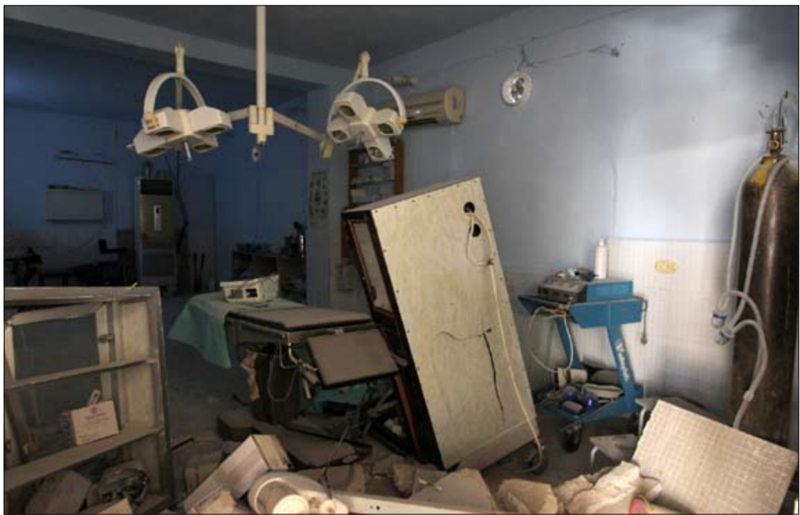
الدمار الذي لحق بمستشفى عدنان الذي تديره منظمة «أوسم» الطبية بعد تدميره بغارة جوية في حلب