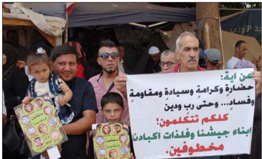
اعتصام اهالي العسكريين المخطوفين على يد «داعش» في ساحة رياض الصلح

لكن الوسط السياسي مازال يضح بالمرود على الخطاب التصعيدي الأخير لأمين العام لحزب الله حسن نصرالله. النائب أنطوان زهرة وردا على قول السيد نصرالله في ساحة رياض الصلح والمقاومة هي الخلاصة الذهبية، قال «أن ثلاثية لبنان