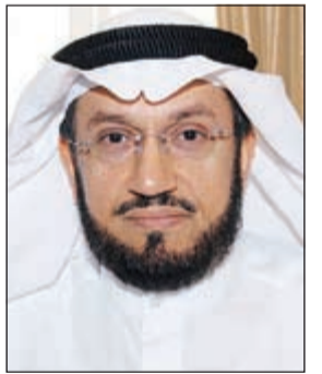
د. وليد الشعيب

أكد وكيل وزارة الاوقاف المساعد لشؤون المساجد د. وليد الشعيب ان الاهتمام بالمساجد وحسن رعايتها من اهم اولويات الوزارة التي توليها عناية فائقة، مشيراً الى دور قطاع المساجد في رعاية بيوت الله والاشراف على ترتيب امورها.