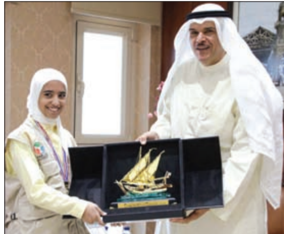
الشيخ سلمان الحمود مكرماً إحدى الفئات في المجال العلمي