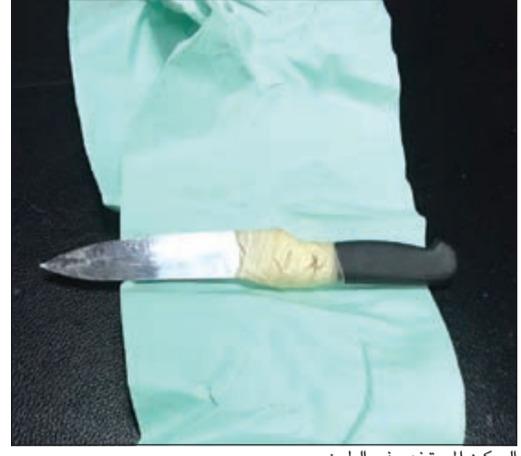
السكين المستخدم في الطعن

وقال مصدر أمني إن المشاجرة بدأت في أحد مطاعم صناعة الجهراء بين 4 أشخاص بعد أن