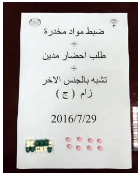
الحبوب المضبوطة مع المواطن المدين