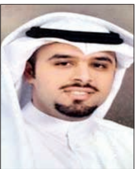
الحامي قتيبة السعيد

شُرّ قطاع الأمن العام بمحافظتي حولي والاحمدي حملتين أمنيتين قاد الأولى مدير أمن حولي العميد عابدين العابدين على منطقة النقرة. وتم خلالها توقيف 5 اشتباه سكر و4 مدينين و29 انتهاء اقامة و17 حالة تغيب وشخص دخل البلاد بصورة