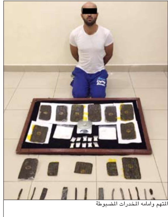
المتهم وامامه المخدرات المضبوطة

قال مصدر امني إن مديرية امن الفروانية أحالت الى الإبعاد الإداري 50 وافدا ووافدا ضبطوا في أوكار مشبوهة خلال حملة موسعة