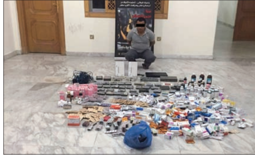
الوافد وامامه الادوية المسروقة

فتح تحقيق للوقوف على أوجه القصور التي مكنت الممنهجة