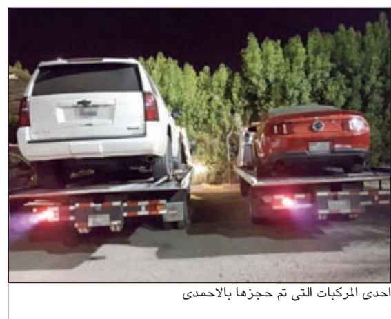
احدى المركبات التي تم حجزها بالاحمدى