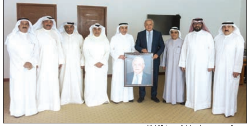
د.بدر العيسى مع مجلس إدارة جمعية الكشافة

أكد وزير التربية ووزير التعليم العالي د.بدر العيسى انه سيخاطب ديوان الخدمة المدنية لتعديل وضع موجهي الكشافة بالتربية والحفاظ على كادرهم التعليمي، مشيراً الى انه سيكون سندا لهم من خلال وجوده كعضو في مجلس الخدمة المدنية.